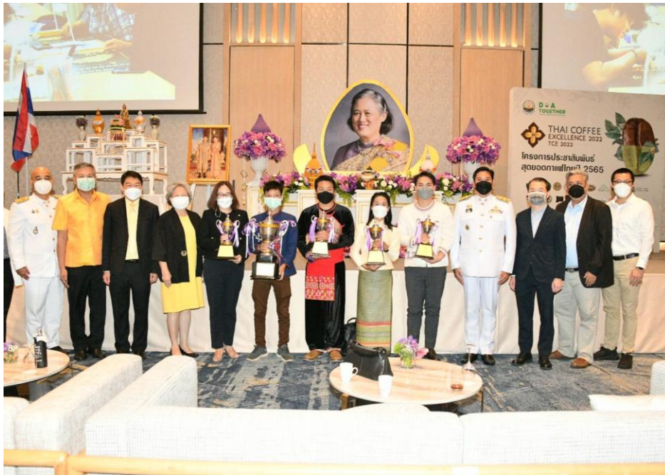
พิธีรับถ้วยพระราชทาน