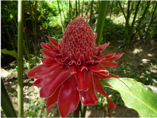
พันธุ์พ่อ