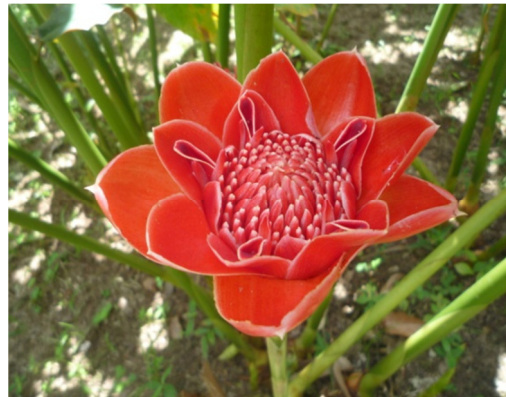
พันธุ์แม่