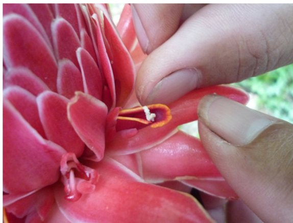
นำละอองเกสรตัวผู้วางไว้ในกลีบดอกจริง