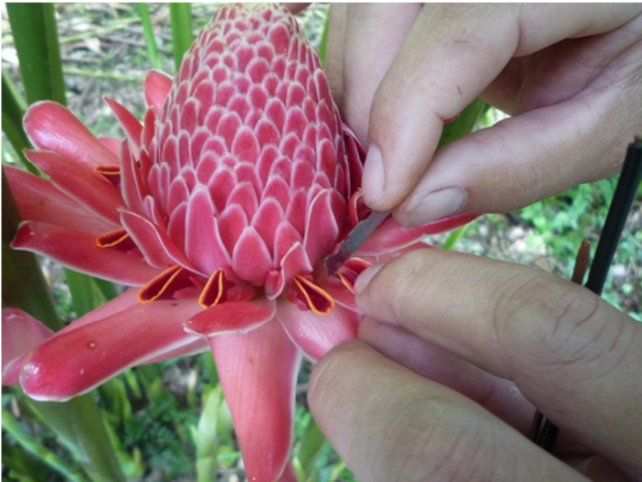
การเปิดดอกตัวเมีย