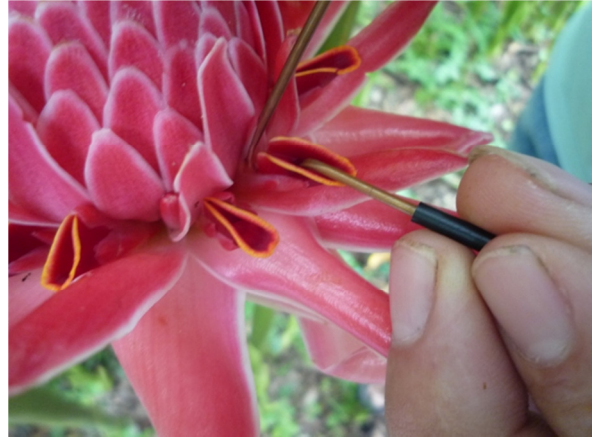
การกำจัดเกสรตัวผู้