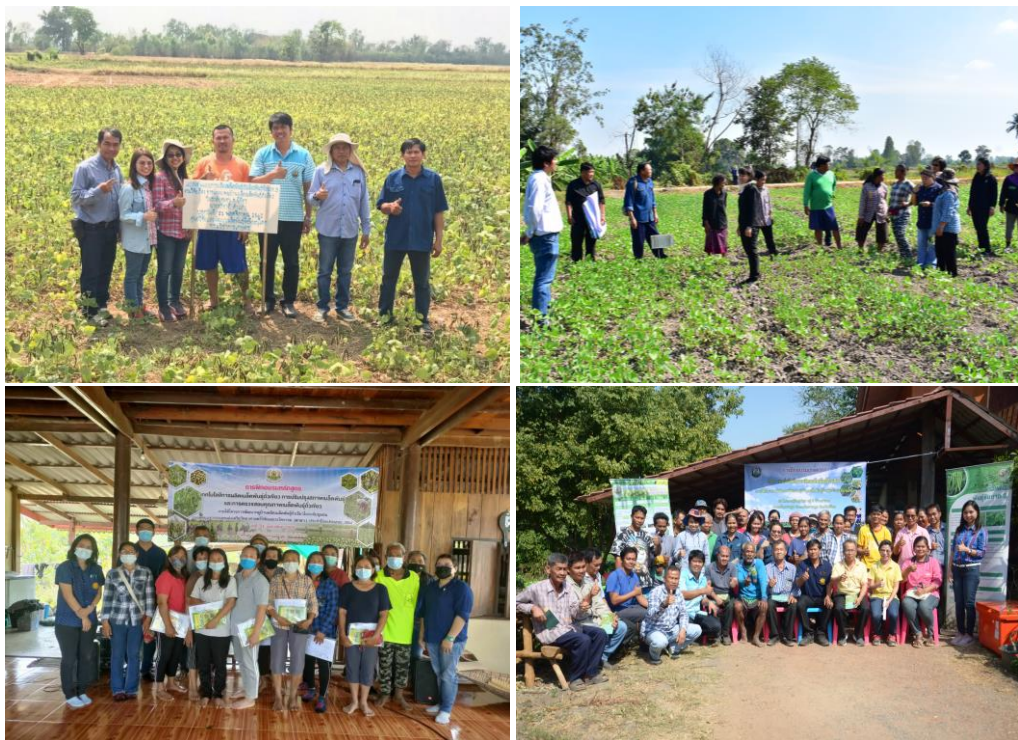
Figure 4 Extending utilization of mungbean variety, Chai Nat 3 to farmers.