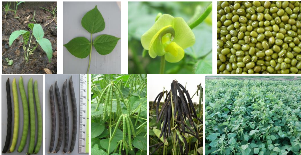
Figure 3 Characteristics of Chai Nat 3