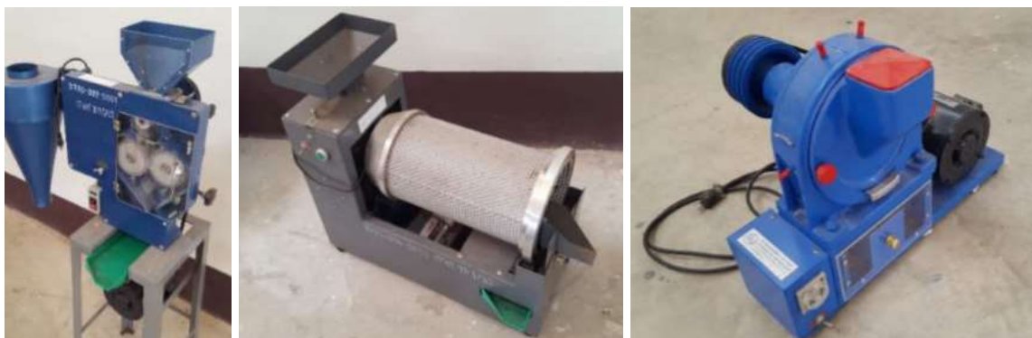
ภาพที่ 4 เครื่องกะเทาะข้าวเปลือก, เครื่องคัดคุณภาพข้าวแบบตะแกรงกลมยาว, เครื่องขัดข้าวขาว ตามลำดับ

1.3 เครื่องมือที่ใช้ประกอบในการเก็บข้อมูลอื่น ๆ ได้แก่ เครื่องทดสอบคุณภาพข้าว เช่น เครื่องกะเทาะข้าวเปลือก, เครื่องคัดคุณภาพข้าวแบบตะแกรงกลมยาว, เครื่องขัดข้าว, เครื่องทำความสะอาดข้าวเปลือกแบบใช้ลม และ เครื่องซีลสูญญากาศ (ไม่ได้อยู่ในข้อกำหนด มอก.แต่ใช้ประกอบในการเก็บข้อมูลเพิ่มเติม)