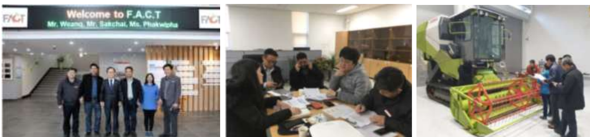
ภาพที่ 5 การฝึกอบรมดูงานที่เกี่ยวข้องกับงานทดสอบมาตรฐานเครื่องจักรกล ณ ต่างประเทศ

2.1 ส่งบุคลากรไปรับการฝึกอบรมและดูงานที่เกี่ยวข้อง โดยมีการศึกษารายละเอียดร่าง พ.ร.บ. เครื่องเกี่ยวนวดข้าวตามมาตรฐาน มอก 1428-2560. การเข้ารับการฝึกอบรมหลักการปฏิบัติของห้องปฏิบัติการ 17025 สำนักงานมาตรฐานผลิตภัณฑ์อุตสาหกรรม กระทรวงอุตสาหกรรม รวมทั้งการฝึกอบรมดูงานที่เกี่ยวข้องกับงานทดสอบมาตรฐานเครื่องจักรกล ณ ต่างประเทศ เพื่อเตรียมความพร้อมและเพิ่มความชำนาญของบุคลากรในการทดสอบให้ถูกต้อง