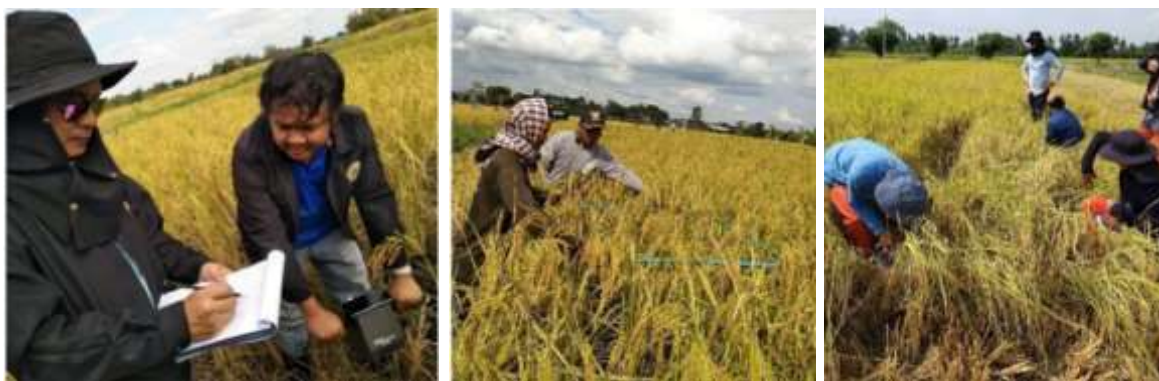
ภาพที่ 7 การวัดแรงต้านการแทงทะลุของดิน, การวางกรอบเก็บข้อมูล และการเก็บข้าวเปลือกก่อนเกี่ยวในกรอบเก็บข้อมูล ตามลำดับ

2.2.2 การฝึกทดสอบเก็บข้อมูลในการเกี่ยวนวดข้าวภาคสนาม ซึ่งจะทำการทดสอบการเกี่ยวนวดในแปลงนาที่เตรียมไว้ตามมาตรฐาน มอก. โดยจะเก็บข้อมูลเพื่อใช้ในการประเมินประสิทธิภาพการทำงาน ได้แก่ อัตราการเกี่ยวนวด (ไร่ต่อชั่วโมง) อัตราการสิ้นเปลืองเชื้อเพลิง เพอร์เซ็นต์การสูญเสียของเมล็ดข้าวเปลือกตามวิธีปฏิบัติของ มอก. การวัดความดังของเสียงขณะปฏิบัติงานเพื่อความปลอดภัยของผู้ควบคุมเครื่องเกี่ยวนวด ตลอดจนการทดสอบความคงทนของเครื่องเกี่ยวนวด เป็นต้น