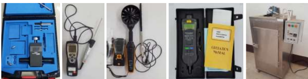
ภาพที่ 3 ตัวอย่างอุปกรณ์ที่ใช้ทดสอบ ได้แก่ เครื่องวัดแรงต้านแรงกดดิน เครื่องวัดอุณหภูมิ เครื่องวัดความเร็วลม เครื่องวัดความเร็วรอบ และ ตู้อบลมร้อน ตามลำดับ

1.2 อุปกรณ์ที่ใช้ในการทดสอบ ได้แก่ เครื่องวัดความดังของเสียง (Sound meter), เครื่องวัดอุณหภูมิแบบดิจิตอลเคลื่อนที่ (Thermometer), อุปกรณ์วัดความต้านทานแรงกดดิน (Soil cone penetrometer), อุปกรณ์วัดความเร็วลม (Hot wire anemometer), เครื่องชั่งน้ำหนักอิเล็กทรอนิกส์ (Digital Scales) พิกัดโหลด 6 กิโลกรัม, เครื่องชั่งน้ำหนักอิเล็กทรอนิกส์พิกัดโหลด 300 กิโลกรัม, เครื่องวัดความเร็วรอบแบบใช้แสงเลเซอร์และแบบสัมผัส (Tachometer), เครื่องเก็บข้อมูลอัตโนมัติ (Data Logger), ตู้อบลมร้อน (Hot air Oven), เครื่องวัดความชื้นข้าวเปลือกภาคสนามแบบใช้ความจุไฟฟ้า (Capacitance Type Moisture Meter), เครื่องดูดฝุ่น-ดูดน้ำ และ กระจกตวงน้ำมัน เป็นต้น ได้รับการรับรองมาตรฐานทุกอุปกรณ์