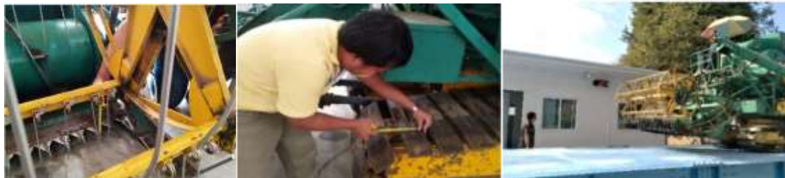
ภาพที่ 6 การวัดความสูงการตัด, การวัดมิติของแป้นล้อตีนตะขาบ และการชั่งน้ำหนักของรถเกี่ยว ตามลำดับ

2.2.1 ฝึกการทดสอบเก็บข้อมูลในห้องปฏิบัติการ เช่น การตรวจสอบคุณลักษณะของเครื่องเกี่ยวนวดข้าว (ส่วนประกอบและการทำ) การตรวจสอบส่วนประกอบต่าง ๆ ของรถเกี่ยวข้าว และเครื่องหมายฉลากต่าง ๆ แล้วทำการชั่งน้ำหนักตัวเครื่องเกี่ยวนวดข้าวพร้อมน้ำมันเต็มถังเพื่อหาแรงกดต่อพื้นที่