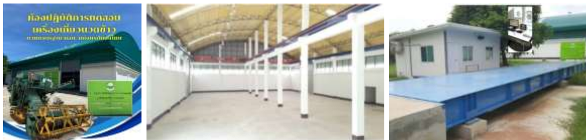
ภาพที่ 2 อาคารปฏิบัติการทดสอบ และ เครื่องชั่งน้ำหนักขนาดพิกัดโหลด 60 ตัน

1.1 โครงสร้างภายนอก ได้แก่ อาคารปฏิบัติการทดสอบมาตรฐานเครื่องจักรกลเกษตร ขนาด 40 x 20 เมตร และ เครื่องชั่งน้ำหนักขนาดพิกัดโหลดไม่เกิน 60 ตัน