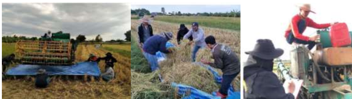
ภาพที่ 9 การใช้ผ้าพลาสติกคลุมรอบเก็บข้อมูล, การคัดแยกข้าวเปลือกร่วงและตีตรง และการวัดอัตราสิ้นเปลืองน้ำมันเชื้อเพลิง ตามลำดับ