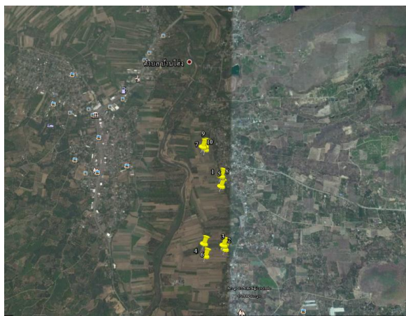
ภาพที่ 1 พิกัดแปลงทดสอบหอมแดง ต.บ้านโฮ้ง อ.บ้านโฮ้ง จ.ลำพูน

2. สัมภาษณ์วิธีการปลูกหอมแดงของเกษตรกร พบว่า เกษตรกร อ.บ้านโฮ้ง จ.ลำพูน สามารถปลูกหอมแดงได้ 2 ช่วงในรอบปี ได้แก่