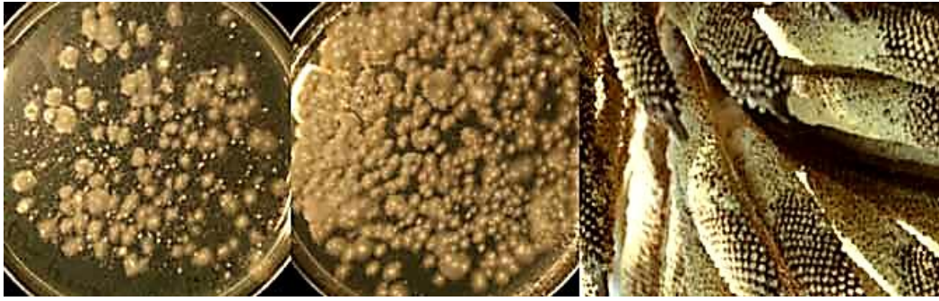
Figure 2 Pollen dispersed onto Fusarium -selective media reveals contamination by Fusarium oxysporum f.sp. elaeidis (Cooper & Rusli, 2014).