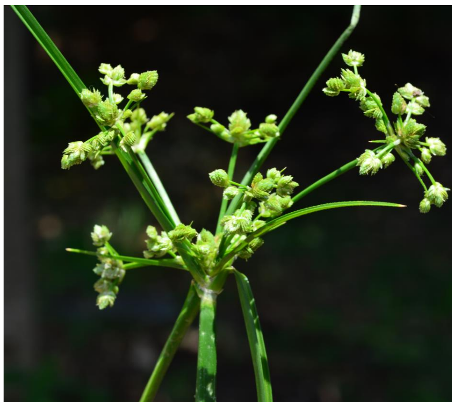
figure 1 Inflorescence of Deep-rooted sedge