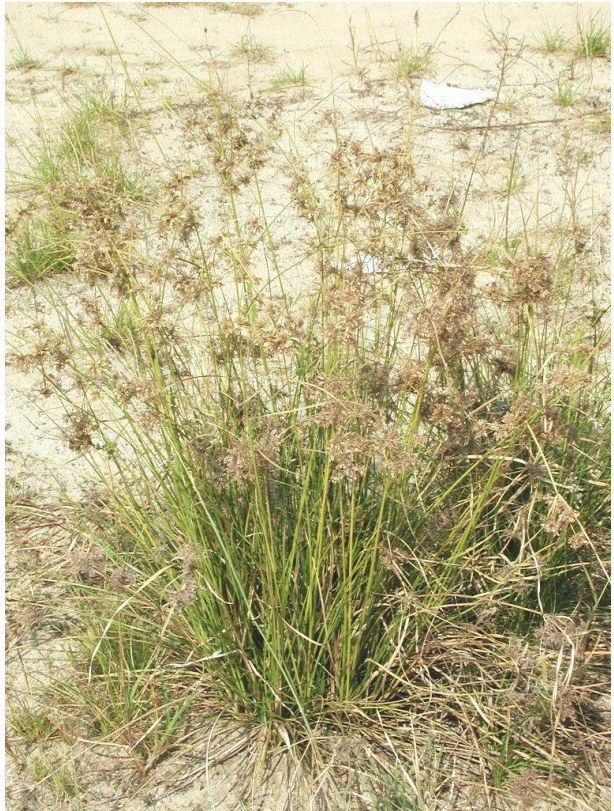
Figure.2 Habit of Deeprooted sedge found at 1 st detection site.