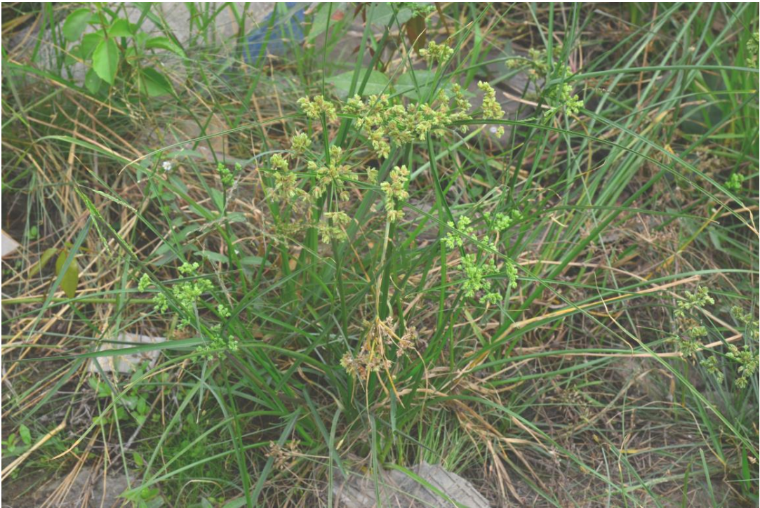
Figure 3 Deeprooted sedge among other plants, detected in residential area in 2 nd site