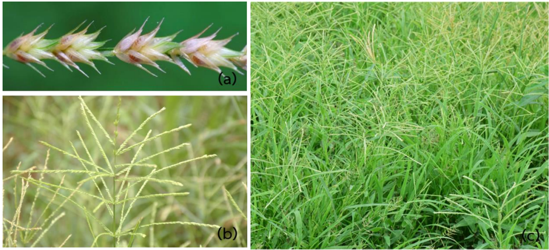
Figure 1 A. racemosa (Heyne ex Roth) Ohwi; (a)-(b) inflorescence and (c) habitat.