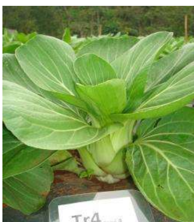
(ง) ต้นผักกาดฮ่องเต้การค้า ร้านค้า 4