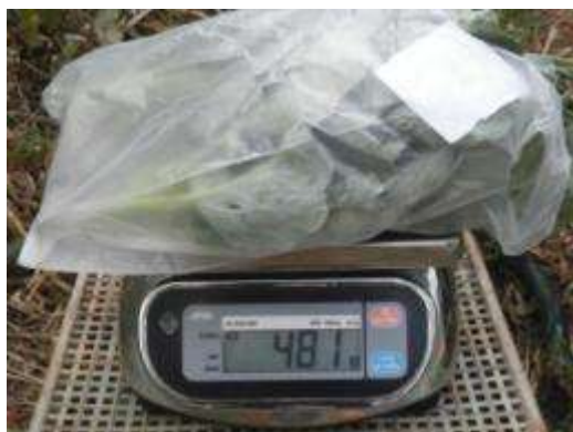
(ฉ) สุ่มชั่งน้ำหนัก และตรวจสอบคุณภาพ 10 ต้น/ซ้ำ