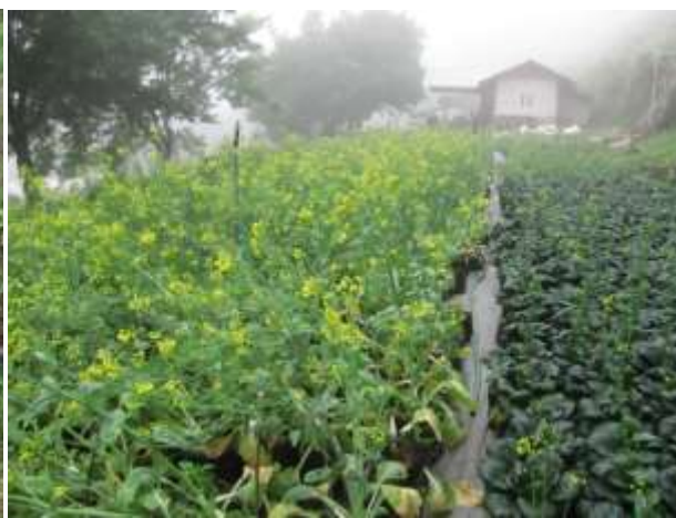
แปลงผักกาดวางตุ้งที่นำพันธุ์มาจาก AVRDC