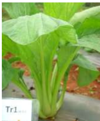
(ก) ต้นกวาดตุงการคำ ร้านค้า 1