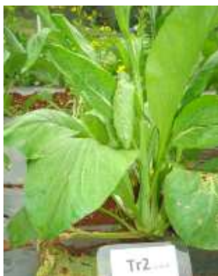
(ข) ต้นกวาดตุงการคำ ร้านค้า 2