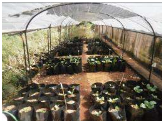
(จ) กวางตุ้งหลังย้ายปลูกลง 2 สัปดาห์ ก่อนนำไปดูแลรักษาในโรงเรือนกันแมลง