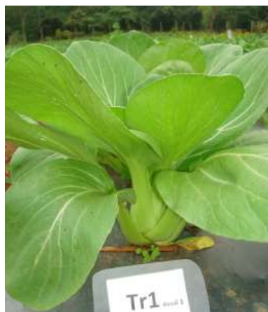
(ก) ต้นผักกาดฮ่องเต้การค้า ร้านค้า 1