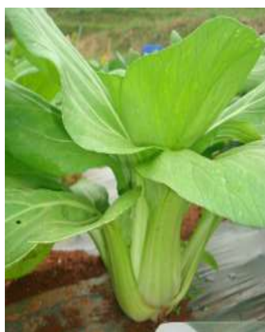
(จ) ต้นผักกาดฮ่องเต้การค้า ร้านค้า 5