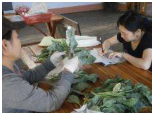
(ง) วัดขนาดก้านคะน้า