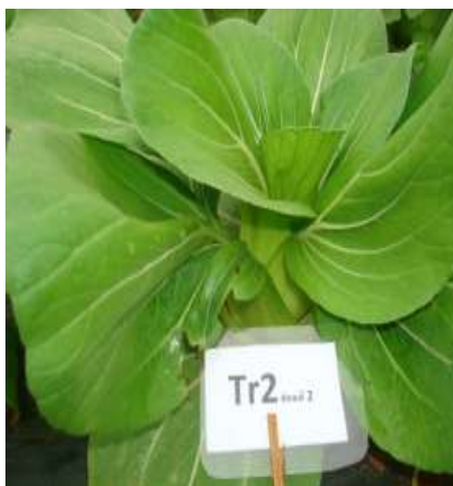
(ข) ต้นผักกาดฮ่องเต้การค้า ร้านค้า 2