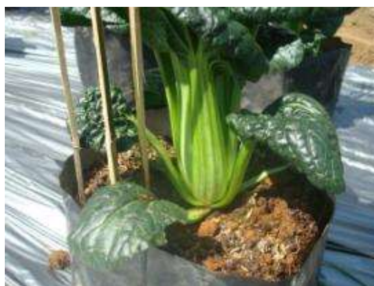
ผักกาดฮ่องเต้มีรูปร่างต้นทรงแจกัน แผ่นใบเรียบ และหนา

ภาพที่ 6. การคัดเลือกพันธุ์ผักกาดกวางตุ้งและผักกาดฮ่องเต้ โดยวิธีการคัดเลือกแบบสายพันธุ์แม่ (Maternal line selection) ในระยะที่สอง ปี 2555 เพื่อผลิตพันธุ์ผสมเปิดทนร้อน ที่ศูนย์วิจัยเกษตรหลวงเชียงใหม่ (ขุนวาง) (ก-ง)