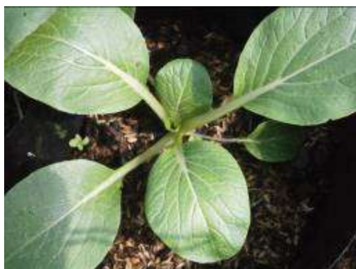
(ก) ต้นกวางตุ้งพันธุ์ LB 010