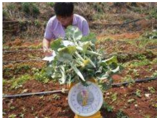
(ซ) ชั่งน้ำหนักกรวม