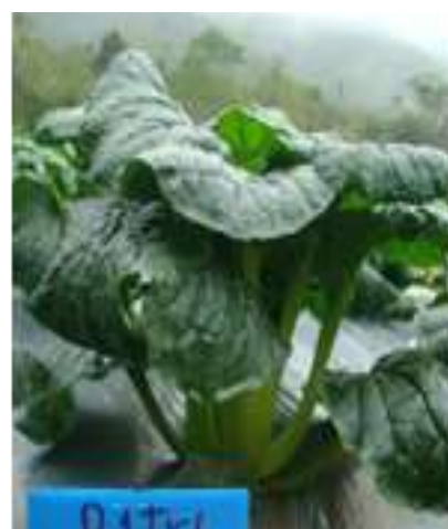
(ฉ) ต้นผักกาดฮ่องเต้ LB 003