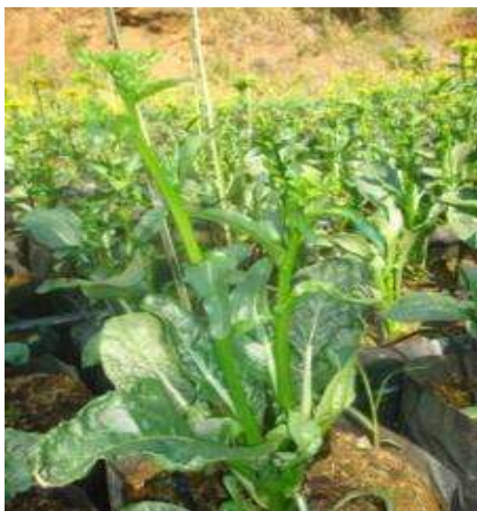
(ค) ลักษณะต้นที่ดีของกวางตุ้ง