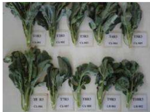
(ฉ) แสดงลักษณะการเจริญเติบโตของต้นคะน้าแต่ละสายพันธุ์

ภาพที่ 10. การเปรียบเทียบพันธุ์คะน้าหนร้อนแต่ละสายพันธุ์ที่ปลูกในช่วงฤดูร้อน ที่ศูนย์วิจัยเกษตรหลวง เชียงใหม่ (ขุนวาง) (ก-ญ)