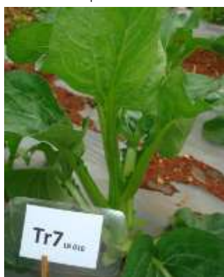
(ช) ต้นกวาดตุง LB 012