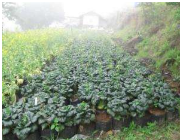
(ก) แปลงผักกาดฮ่องเต้ที่นำพันธุ์มาจาก AVRDC