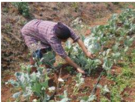
(ช) เก็บเกี่ยวต้นคะน้า