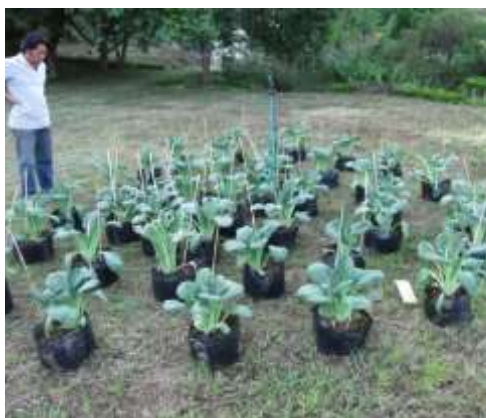
คัดต้นวางตุ้งทำเช่นเดียวกันกับผักกาดฮ่องเต้