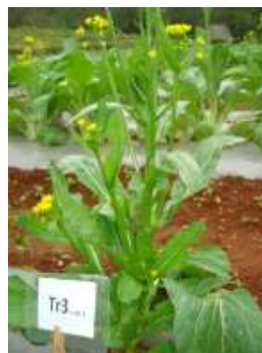
(ค) ต้นกวาดตุงการคำ ร้านค้า 3