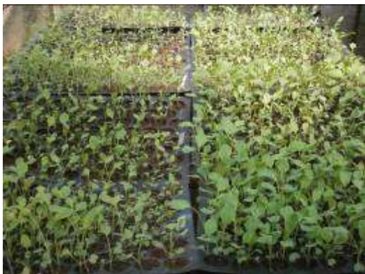
(ก) เพาะกล้าคะน้าแต่ละสายพันธุ์