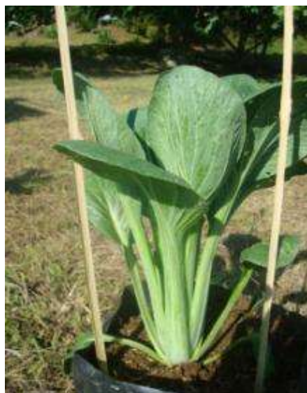
กวางตุ้งจะมีรูปร่างของต้นเป็นทรงแจกัน ก้านใบสีเขียว และไม่แตกหน่อด้านข้าง