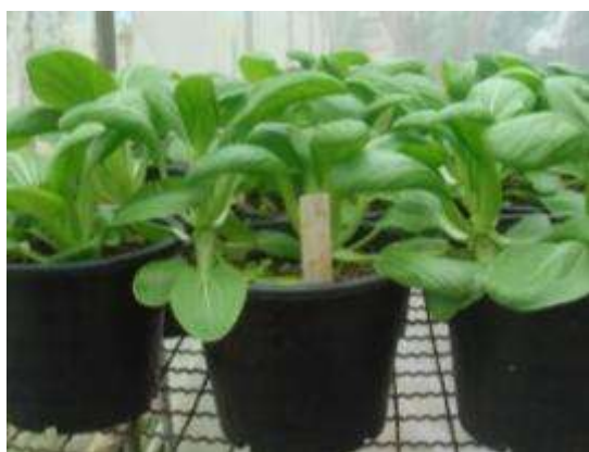
(ง) ลักษณะต้นที่ดีของฮ่องเต้