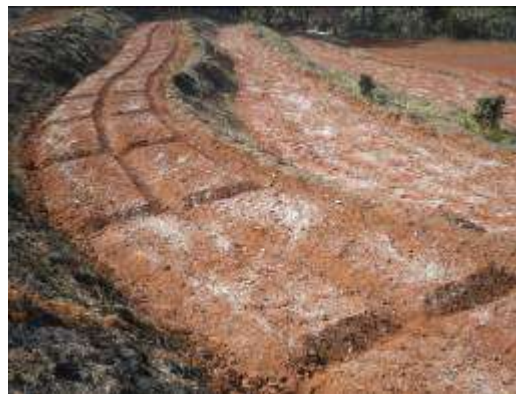
(ข) เตรียมแปลงปลูกคะน้าแต่ละสายพันธุ์