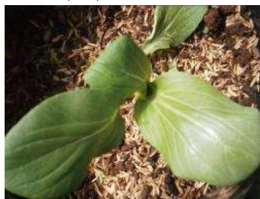
(ง) ต้นฝักกาดฮ่องเต้พันธุ์ ร้านค้า 2