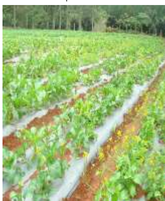
ซ) แปลงเปรียบเทียบพันธุ์กวาดตุงแต่ละสายพันธุ์

ภาพที่ 8. ผักกาดฮ่องเต้แต่ละสายพันธุ์ที่นำมาปลูกเปรียบเทียบที่ศูนย์วิจัยเกษตรหลวงเชียงใหม่ (ผาเงม)