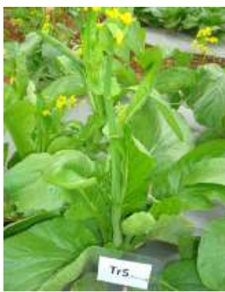
(จ) ต้นกวาดตุงการคำ ร้านค้า 5