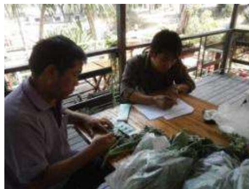
(ญ) บันทึกข้อมูลคุณภาพของคะน้า