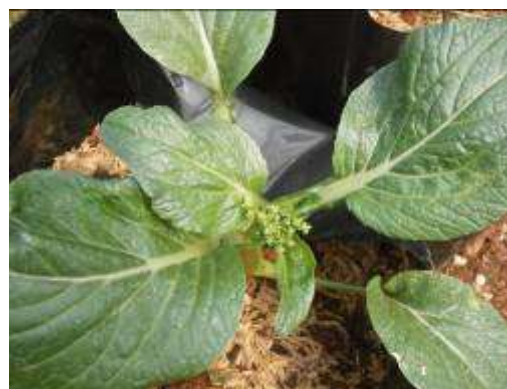
(ข) ต้นกวางตุ้งพันธุ์ LB 012