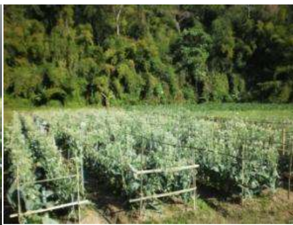
(ข) ใช้ไม้ปักคัดเลือกรูปทรงต้นคะน้าหลังปลูก 30 วัน