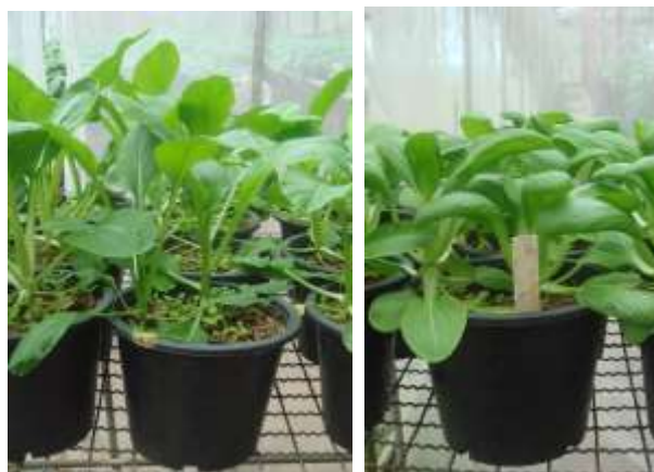
(ฉ) กวางตุ้งและฮ่องเต้หลังย้ายปลูกลง 3 สัปดาห์ในโรงเรือนกันแมลง

ภาพที่ 7. กวางตุ้งและฮ่องเต้แต่ละสายพันธุ์หลังย้ายปลูกลง 2 สัปดาห์ ก่อนนำไปดูแลรักษาในโรงเรือนกันแมลงที่ศูนย์วิจัยเกษตรหลวงเชียงใหม่ (ผาเง่ม) (ก-ฉ)