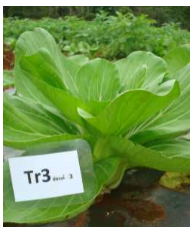
(ค) ต้นผักกาดฮ่องเต้การค้า ร้านค้า 3