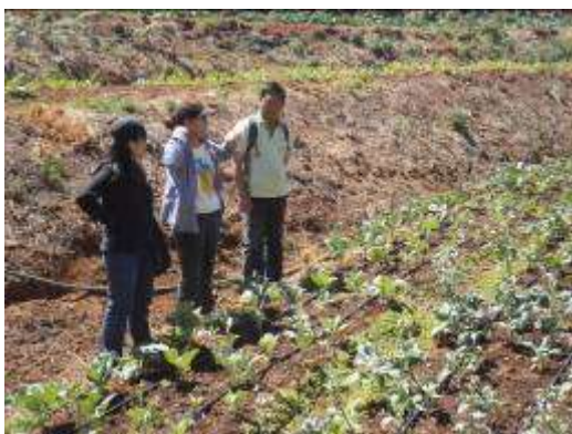
(จ) เก็บข้อมูลการเจริญเติบโตของต้นคะน้า