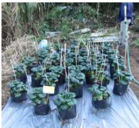
(ค) คัดต้นผักกาดฮ่องเต้ที่ดีที่สุด 10-40 ต้นปลูกลงตรงกลาง และตีรองลงมาปลูกรอบนอก