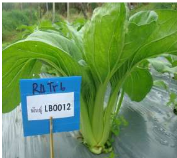
ใช้ไม้ปักคัดเลือกทรงต้นวางตุ้งที่มีลักษณะดี 200-5,000 ต้น หลังปลูกลง 30 วัน