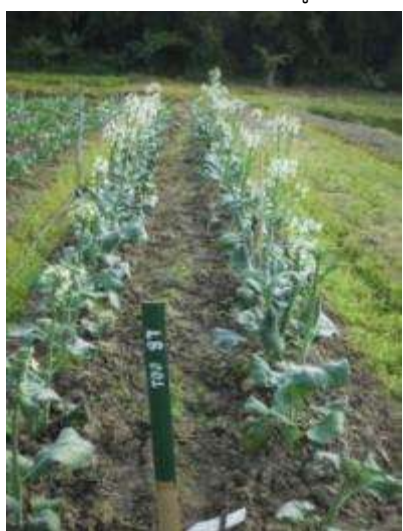
(ค) ปล่อยให้ต้นคะน้าแต่ละสายพันธุ์ผสมข้ามตามธรรมชาติ