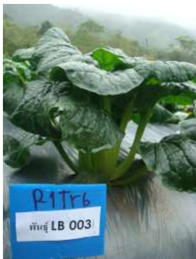
(ข) ใช้ไม้ปักคัดเลือกทรงต้นผักกาดฮ่องเต้ที่มีลักษณะดี 200-5,000 ต้น หลังปลูกลง 30 วัน