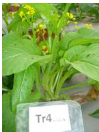
(ง) ต้นกวาดตุงการคำ ร้านค้า 4