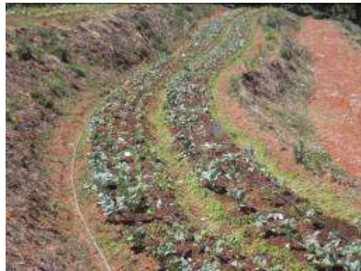
(ง) การเจริญของต้นคะน้าหลังปลูก 30 วัน