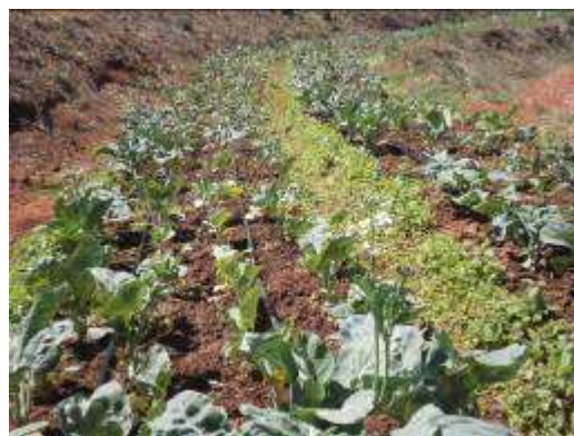
(ฉ) ต้นคะน้าที่เจริญเติบโตเต็มที่พร้อมเก็บเกี่ยว