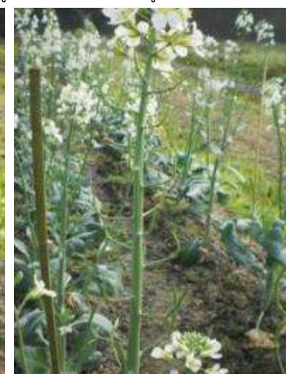
(ง) การติดฝักของต้นคะน้า

ภาพที่ 4. การคัดเลือกพันธุ์คะน้าโดยวิธีการคัดเลือกแบบสายพันธุ์แม่ (Maternal line selection) เพื่อผลิตพันธุ์ผสมเปิดที่ ศูนย์วิจัยเกษตรหลวงเชียงใหม่ (ขุนวาง) (ก-ง)