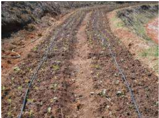
(ค) ติดตั้งระบบน้ำหยด