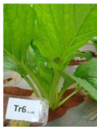
ฉ) ต้นกวาดตุง LB 010