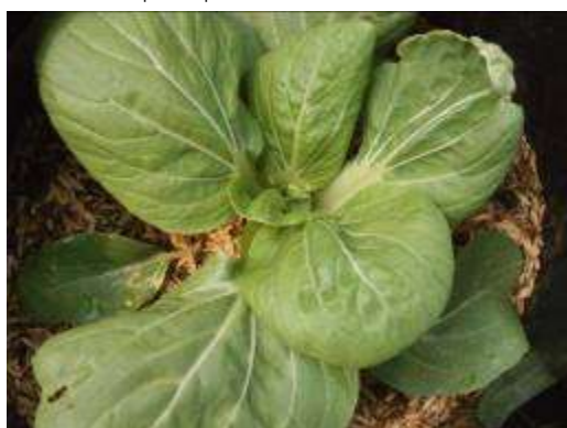
(ค) ต้นฝักกาดฮ่องเต้พันธุ์ ร้านค้า 1