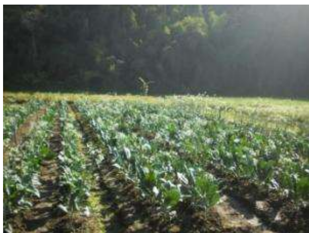
(ก) แปลงคัดเลือกคะน้า หลังปลูก 20 วัน

ปี 2556 ดำเนินการคัดเลือกคะน้าพันธุ์ที่ได้รับจาก AVRDC จำนวน 2 สายพันธุ์ ได้แก่ LB 001 และ LB 002 และคะน้าพันธุ์การค้าเบอร์ 1-5 โดยปล่อยให้ดอกผสมข้ามกันตามธรรมชาติ พบว่าสายพันธุ์ LB 001 ได้เมล็ดทั้งหมด 246 กรัม สายพันธุ์ LB 002 ได้เมล็ดทั้งหมด 160 กรัม ส่วนพันธุ์การค้าเก็บเมล็ดรวมได้ทั้งหมด 1,045 กรัม (ภาพที่ 4)