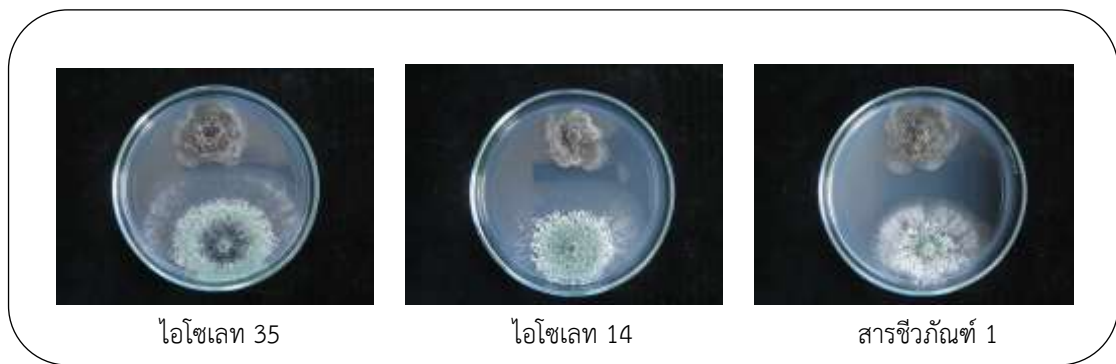
ภาพที่ 3 เปรียบเทียบประสิทธิภาพของราไตรโคเดอร์มา ในการยับยั้งการเจริญของเส้นใยเชื้อรา P. citricarpa โดยวิธี Dual Culture test หลังจากบ่มเชื้อไว้ 3 วันที่อุณหภูมิห้อง