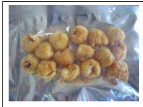
ภาพที่ 1.1-1 แสดงตัวอย่างผลิตภัณฑ์เนื้อลำไยทอดกรอบสุญญากาศ จากผลทดสอบเบื้องต้น

ตารางที่ 1.1-2 แสดงข้อมูลผลทดสอบเบื้องต้นในการทอดเนื้อลำไยด้วยเครื่องทอดสุญญากาศ ของกลุ่มวิสาหกิจชุมชนตำบลทุ่งนนทรี อ.เขาสมิง จ.ตราด