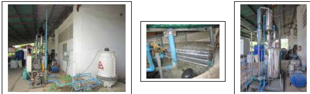
ภาพที่ 1.4-1 แสดงการปรับปรุงชุดควบแน่นไอเดือด

ดังนั้นการพัฒนาปรับปรุงเครื่องทอดสุญญากาศต้นแบบ จึงได้ทำการปรับปรุงพัฒนาชุดควบแน่นไอเดือด ดังแสดงในภาพที่ 1.4-1