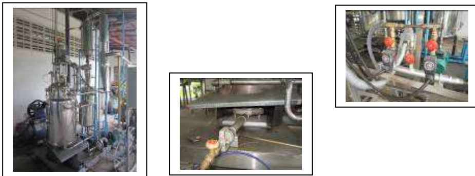
ภาพที่ 1.3-1 แสดงการปรับปรุงชุดควบคุมความร้อนและการหมุนเวียนน้ำมันทอด

ดังนั้นการพัฒนาปรับปรุงเครื่องทอดสุญญากาศต้นแบบ จึงได้ทำการปรับปรุงพัฒนาชุดควบคุมความร้อนและการหมุนเวียนน้ำมันทอด ดังแสดงในภาพที่ 1.3-1