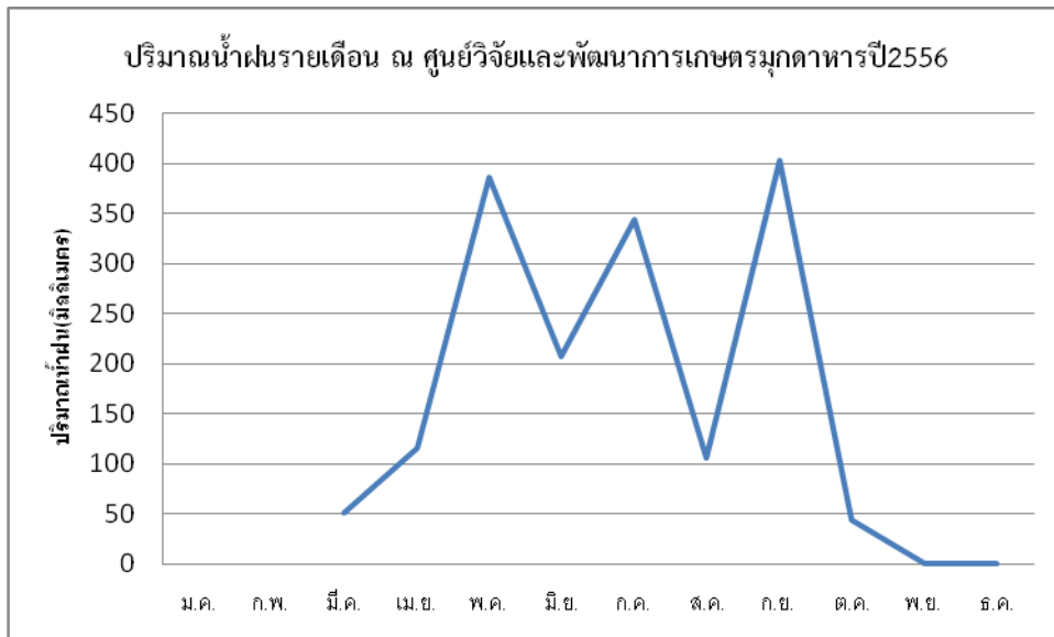
ภาพผนวกที่2 กราฟแสดงปริมาณน้ำฝน ณ ศูนย์วิจัยและพัฒนาการเกษตรมุกดาหารปี 2556