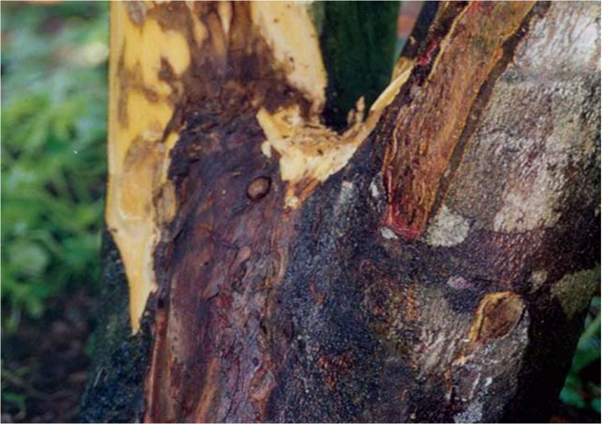
อาการที่โคนต้นส้มโอ