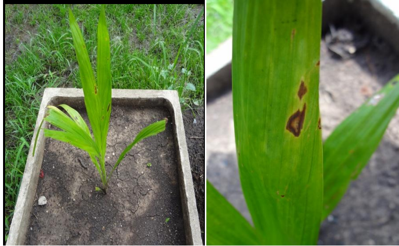
รูปที่ 4 แสดงลักษณะความเป็นพิษของสารกำจัดวัชพืช alachlor, acetochlor, petilachlor, metolachlor และ pendimetaline ต่อดันปาล์มน้ำมัน ที่ระยะ 5 วันหลังพ่นสารกำจัดวัชพืช