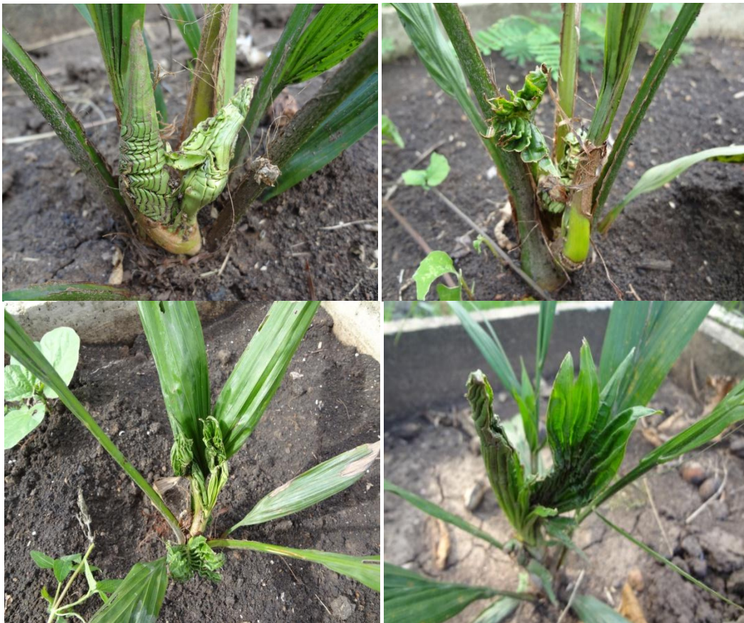
รูปที่ 5 แสดงลักษณะความเป็นพิษของสารกำจัดวัชพืช alachlor, acetochlor, petilachlor, metolachlor และ pendimetaline ต่อดันปาล์มน้ำมัน ที่ระยะ 60 วันหลังพ่นสารกำจัดวัชพืช