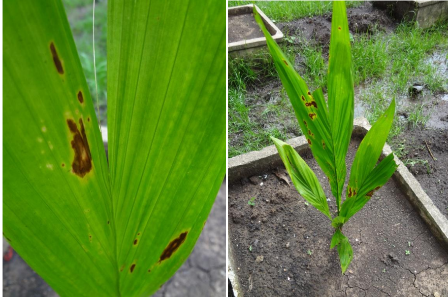
รูปที่ 2 แสดงลักษณะความเป็นพิษของสารกำจัดวัชพืช petilachlor, metolachlor, oxdiazone, atrazine, ametry และ metribuzin ต่อดันปาล์มน้ำมัน ที่ระยะ 5 วันหลังพ่นสารกำจัดวัชพืช