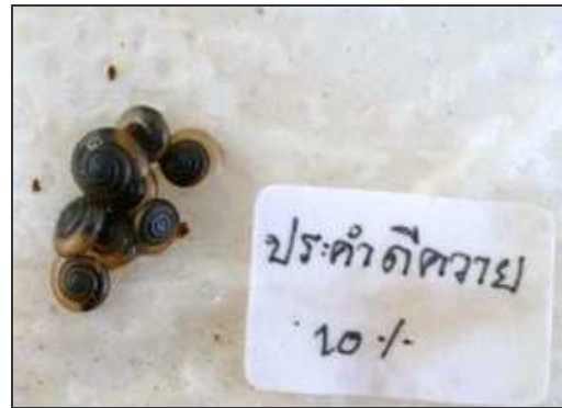
ข. สารสกัดประกาศิตควาย 10%