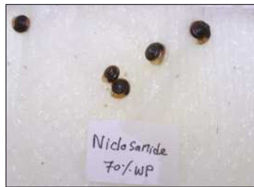
ง. niclosamide 70% WP