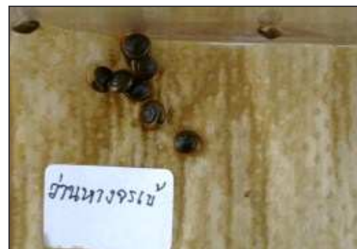
ฉ. สารสกัดบ้านทางจรเข้ 100%

ภาพที่ 2 การทดสอบประสิทธิภาพของสารสกัดจากใบว่านทางจรเข้ กับหอยเลขหนึ่ง Ovachlamys