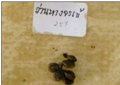
จ. สารสกัดบ้านทางจรเข้ 25%