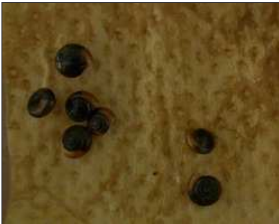
ค. สารสกัดฝักจามจู้รี 100%

ภาพที่ 3 การทดสอบประสิทธิภาพของสารสกัดจากใบมะขามและฝักจามจู้รี กับหอยเลขหนึ่ง Ovachlamys fulgens (Gude) เปรียบเทียบกับกลุ่มควบคุม ภายหลังจากฉีดพ่น 24 ชั่วโมง ในห้องปฏิบัติการ