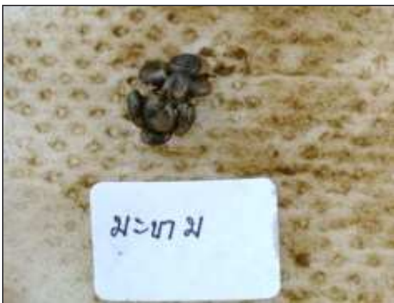
ข. สารสกัดใบมะขาม 100%