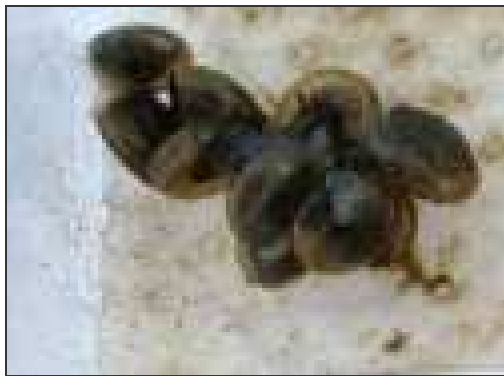
ค. กากเมล็ดชา 10% DP