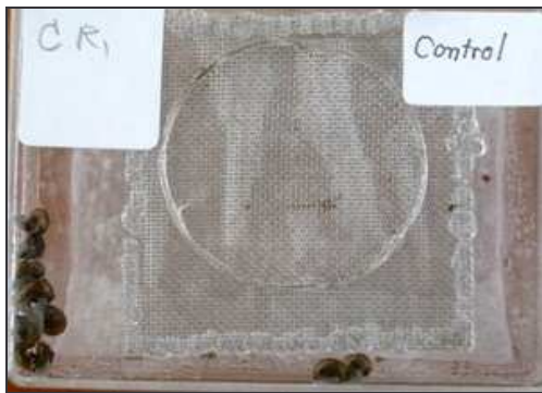
ก. กลุ่มควบคุม (น้ำเปล่า)