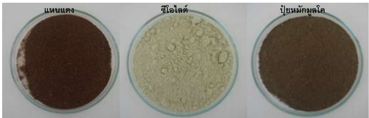
ภาพที่ 2 วัสดุพาชนิดต่างๆ ที่ใช้ในการทดลอง

จากการทดลองเบื้องต้น คณะกรรมการวิชาการของกรมวิชาการเกษตรได้ปรับให้กรรมวิธีที่ทดลองมีความเหมาะสมยิ่งขึ้น จึงได้ทำการทดลองเพิ่มเติมโดยจัดเตรียมวัสดุพาแต่ละตำรับการทดลองใส่ถุงพลาสติกที่เตรียมไว้เมื่อเพาะเลี้ยงหัวเชื้อจุลินทรีย์ละลายฟอสเฟตจนได้ความเข้มข้นที่ต้องการ คือที่ระดับความเข้มข้น 1 \times 10^9 CFU/g จากนั้นใส่หัวเชื้อจุลินทรีย์ละลายฟอสเฟตลงในถุงพลาสติกที่เตรียมไว้ แล้วเก็บรักษาหัวเชื้อจุลินทรีย์ละลายฟอสเฟตไว้ในอุณหภูมิห้อง แล้วจึงตรวจนับเชื้อจุลินทรีย์ละลายฟอสเฟตตามระยะเวลาที่กำหนด คือ 3, 7, 14, 30, 60, 90, 180 และ 270 วัน ตามลำดับ พบว่าเมื่อระยะเวลา 3 วันหลังการเก็บรักษา ปริมาณจุลินทรีย์ละลาย