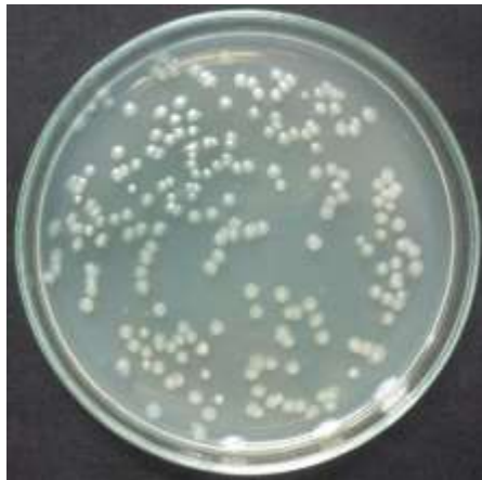
ภาพที่ 4 ปริมาณจุลินทรีย์ละลายฟอสเฟตที่บ่มในวัสดุพาเหนแดง ที่ระยะเวลา 180 วัน หลังการเก็บรักษา โดยเจือจางในระดับความเข้มข้น 10^7 cfu/ml