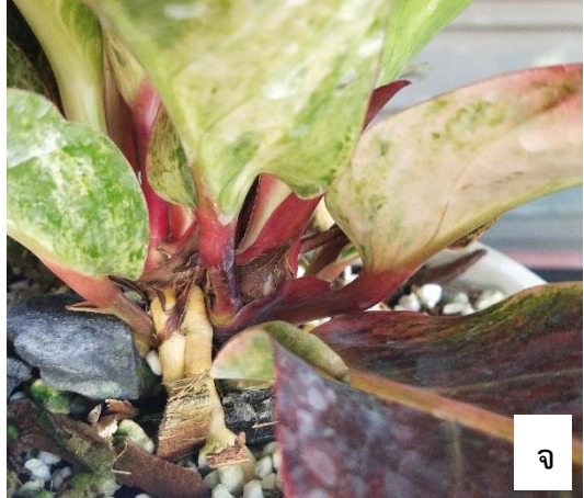
ภาพ ลักษณะทางพฤกษศาสตร์ของหน้าวัวใบพันธุ์บูเก้ ก-ข ทรงต้น ค ใบอ่อน ง ใบแก่ จ ก้านใบ