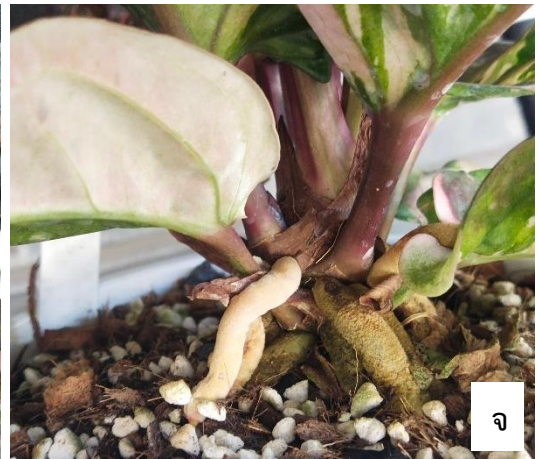
ภาพ ลักษณะทางพฤกษศาสตร์ของหน้าวัวใบพันธุ์ไทก้า ก-ข ทรงต้น ค ใบอ่อน ง ใบแก่ จ ก้านใบ