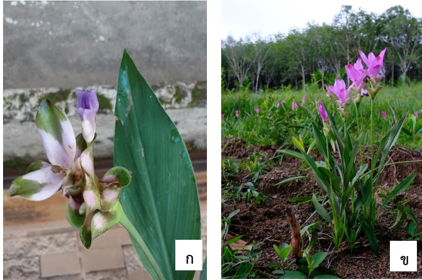
ภาพที่ 1 ลักษณะทางพฤกษศาสตร์ของปทุมมาพันธุ์ แม่ พ่อ ก ลำต้นและช่อดอกมณีกาญจน์ ( Curcuma lithophila ) ข ลำต้นและช่อดอกปทุมมา พบในพื้นที่ จังหวัดสตูล ( Curcuma alismatifolia )