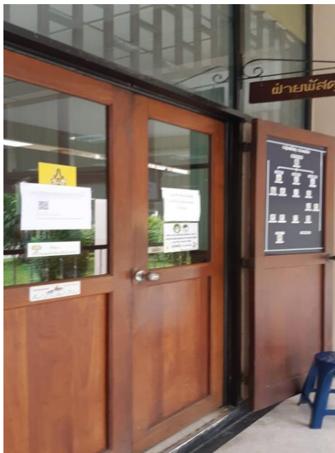
หน้าห้องกลุ่มพัสดุ