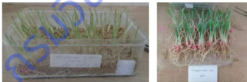
Figure 4 Checking the maize seed germination