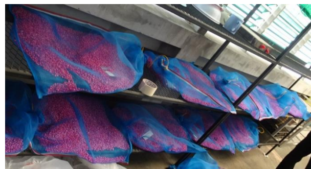
Dry the seeds of maize