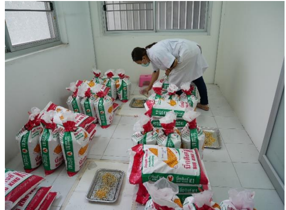
Allow insects to destroy freely