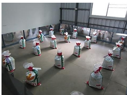
Figure 5 Experiments of Syzygium aromaticum oil encapsulated with freeze-drying against Callosobruchus maculatus at the warehouse for 0-6 months.