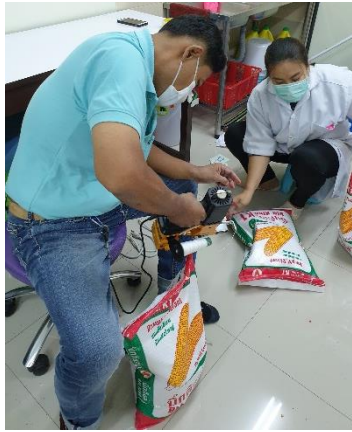
Put the maize seeds in the sack