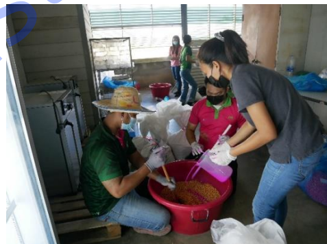
Put insecticide on the maize seeds