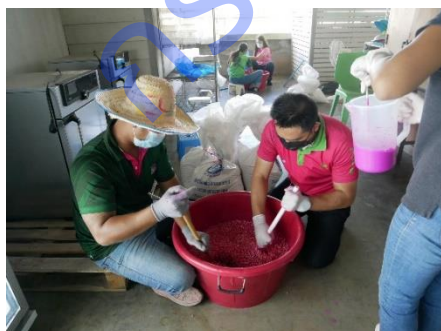
Coat the corn seeds with pesticides