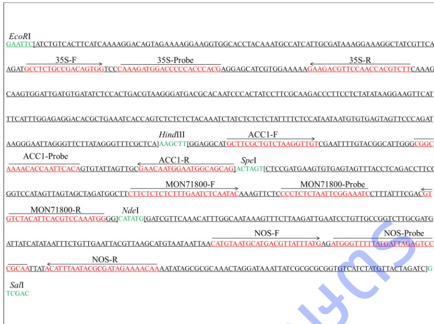
Figure 2.2-2 The fragment sequence of designed insertion genes. The red letter indicates position of forward primer, reverse primer and probe of each gene. The green letter indicates position of restriction enzyme sites.