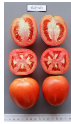
พันธุ์ลูกท้อ