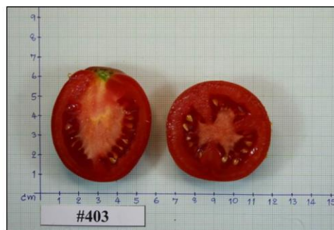
ภาพที่ 3 ผลมะเขือเทศสายพันธุ์ 403 ปลูกในสภาพแปลงช่วงฤดูหนาว ปี 2559