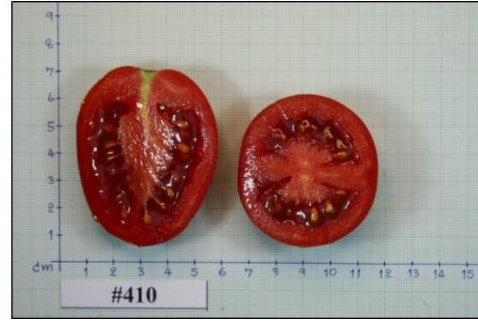
ภาพที่ 4 ผลมะเขือเทศสายพันธุ์ 410 ปลุกในสภาพแปลงช่วงฤดูหนาว ปี 2559