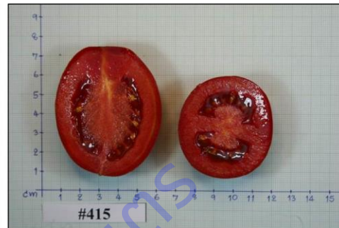
ภาพที่ 5 ผลมะเขือเทศสายพันธุ์ 415 ปลุกในสภาพแปลงช่วงฤดูหนาว ปี 2559