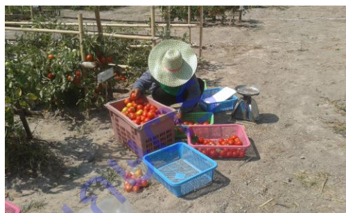
ภาพที่ 1 ต้นมะเขือเทศผลใหญ่ช่วงเก็บเกี่ยวผลผลิต ฤดูหนาว ปี 2559