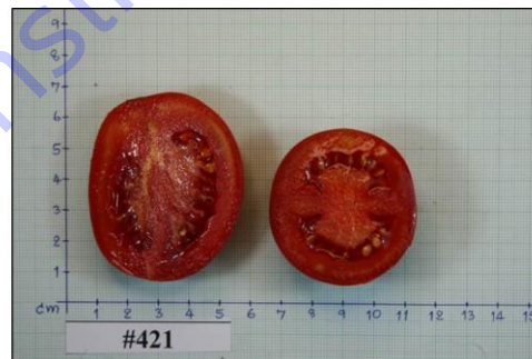
ภาพที่ 6 ผลมะเขือเทศสายพันธุ์ 421 ปลุกในสภาพแปลงช่วงฤดูหนาว ปี 2559