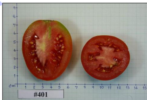
ภาพที่ 2 ผลมะเขือเทศสายพันธุ์ 401 ปลูกในสภาพแปลงช่วงฤดูหนาว ปี 2559