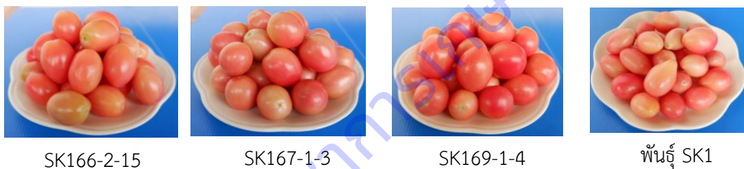
ภาพที่ 2 ผลมะเขือเทศสีดาแปลง อำเภอเมือง จังหวัดศรีสะเกษ พุศจิกายน พ.ศ. 2561- เมษายน พ.ศ. 2562

น้ำหนักผลของมะเขือเทศสีดาสายพันธุ์คัดทั้งสามพันธุ์มีมากกว่าพันธุ์เปรียบเทียบกับพันธุ์ SK169-1-4 มีน้ำหนักผลมากที่สุด รองลงมาได้แก่พันธุ์ SK166-2-15 SK167-1-3 และพันธุ์ SK1 ซึ่งเป็นพันธุ์เปรียบเทียบกับน้ำหนักผลน้อยที่สุด แต่มีค่าความหวานมากที่สุดแตกต่างอย่างมีนัยสำคัญทางสถิติกับสายพันธุ์อื่น ๆ รองลงมาได้แก่พันธุ์ SK167-1-3 SK166-2-15 และ SK169-1-4 พันธุ์ SK167-1-3 มีค่าความหนาเนื้อมากที่สุด แตกต่างอย่างมีนัยสำคัญกับพันธุ์อื่น ๆ มีความหนา 4.33 มม. ที่แปลงอำเภอเมือง และ 4.09 มม.ที่อำเภอวังหิน (ตารางที่ 4 และ 5)