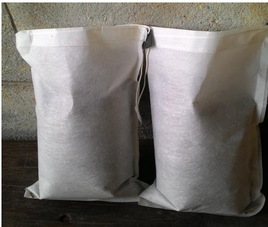
(ช) บรรจุเมล็ดพันธุ์ใส่ถุง