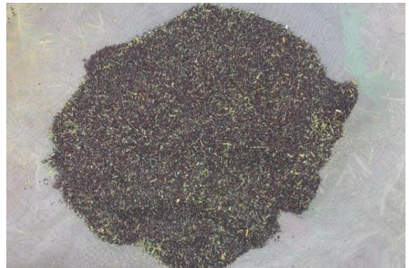
(ฉ) ลักษณะเมล็ดผักกาดขาวปลี