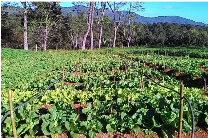
(จ) ลักษณะแปลงผักกาดขาวปลีที่อายุ 30 วัน