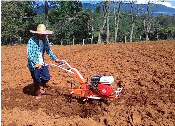
(ก) เตรียมพื้นที่ปลูก