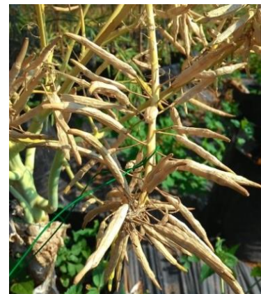
(ข) ลักษณะฝักที่แก่แห้งพร้อมเก็บเกี่ยว