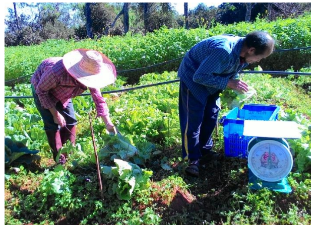
(ฉ) เก็บเกี่ยวผลผลิตต่อต้น