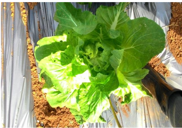
(ค) ลักษณะต้นพันธุ์ที่เข้าปลีดีพอใช้ (D3)