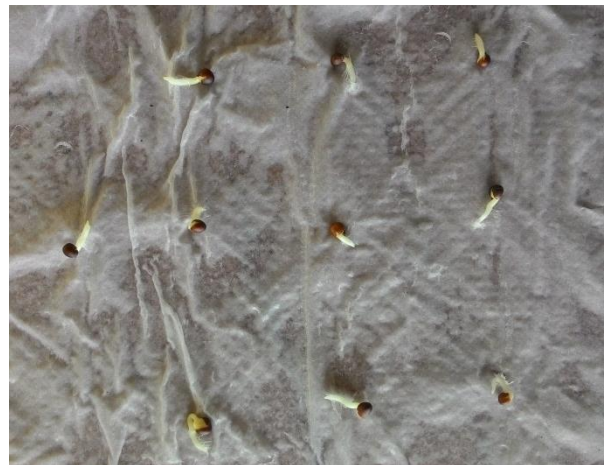
(ซ) ทดสอบความงอกของเมล็ด

ภาพที่ 4 คูแล และเก็บเกี่ยวเมล็ดพันธุ์ ที่ศูนย์วิจัยเกษตรหลวงเชียงใหม่ (ก-ช)