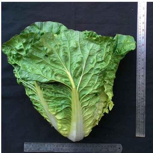
(ก) ลักษณะต้นผักกาดขาวปลีพันธุ์ D1