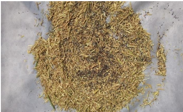
(จ) ลักษณะเมล็ดผักกาดขาวปลี