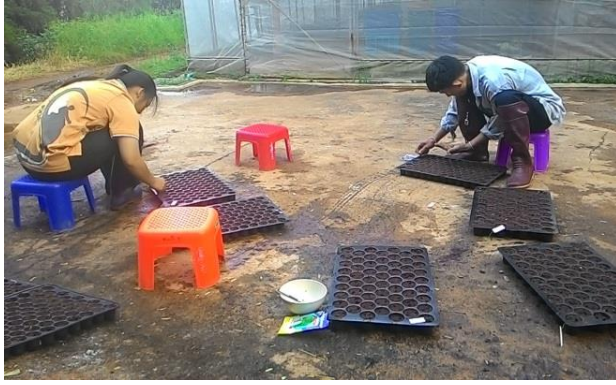
(ก) เพาะเมล็ดผักกาดขาวปลี