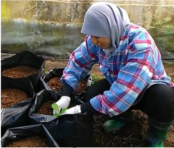
(ค) ปูกลองถุงขนาด 14 นิ้ว