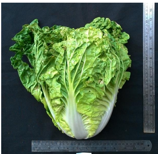
(ข) ลักษณะต้นผักกาดขาวปลีพันธุ์ D2