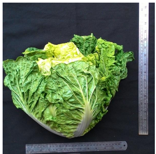
(ค) ลักษณะต้นผักกาดขาวปลีพันธุ์การค้า 1