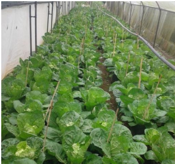
(จ) ลักษณะต้นผักกาดขาวปลีอายุ 30 วัน