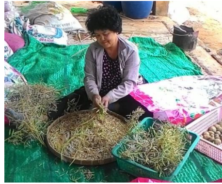
(ง) เอาผักผักกาดขาวปลีออก