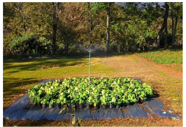
(ง) การปลูกรวมกันวางเป็นชั้น

ภาพที่ 3 ลักษณะต้นพันธุ์ผักกาดขาวปลีที่เข้าปลีดี ถึงดีพอใช้ และนำไปวางเป็นชั้น (ก-ง)