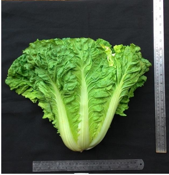
(ง) ลักษณะต้นผักกาดขาวปลีพันธุ์การค้า 2