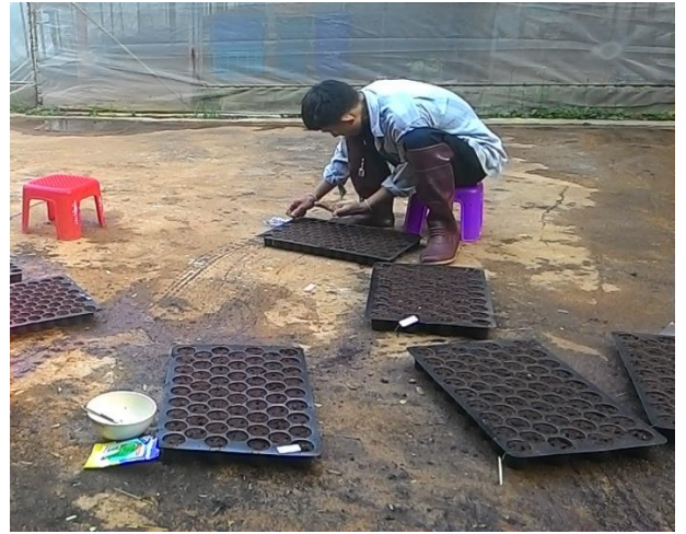
(ข) เพาะเมล็ดพันธุ์ผักกาดขาวปลี