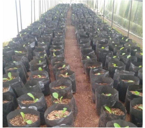
(ง) ต้นผักกาดขาวปลีหลังย้ายปลูก 1 สัปดาห์