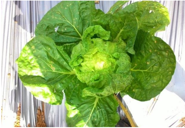
(ก) ลักษณะต้นพันธุ์ที่เข้าปลีดีที่สุด (D1)