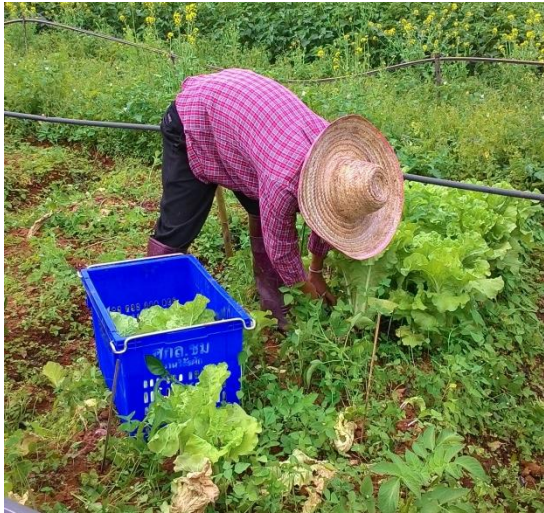
(ซ) เก็บเกี่ยวผลผลิตต่อแปลง