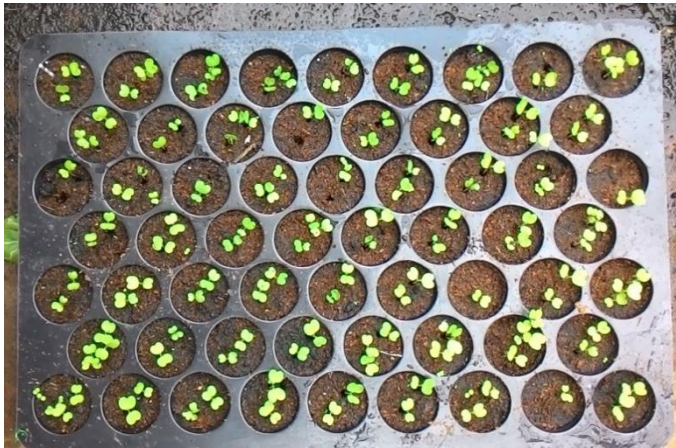
(ค) ต้นกล้าผักกาดขาวปลีอายุ 1 สัปดาห์