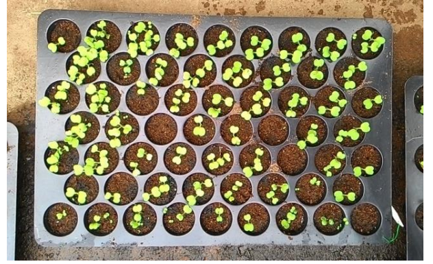
(ข) ต้นกล้าอายุ 1 สัปดาห์