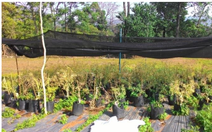
(ก) ฝักที่แก่แห้งพร้อมเก็บเกี่ยว

ภาพที่ 3 ลักษณะต้นพันธุ์ผักกาดขาวปลีที่เข้าปลีดี ถึงดีพอใช้ และนำไปวางเป็นชั้น (ก-ง)