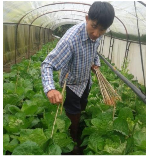
(ฉ) คัดเลือกต้นผักกาดขาวปลี