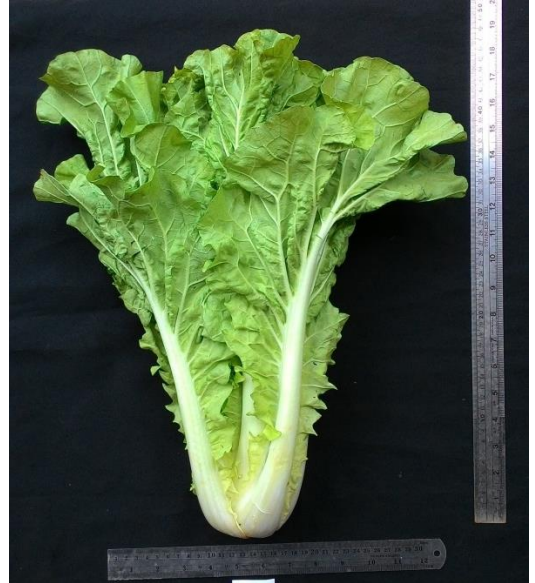
(จ) ลักษณะต้นผักกาดขาวปลีพันธุ์การค้า 1