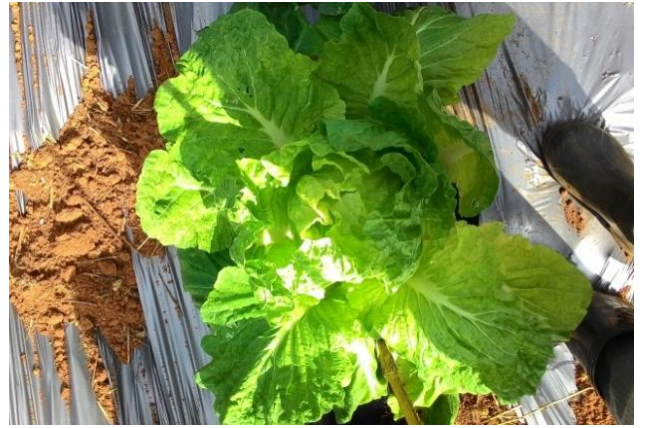
(ข) ลักษณะต้นพันธุ์ที่เข้าปลีดีรองลงมา (D2)