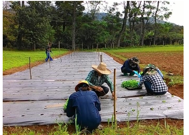
(ง) ปลูกแปลงขนาด 1.2x5 เมตร