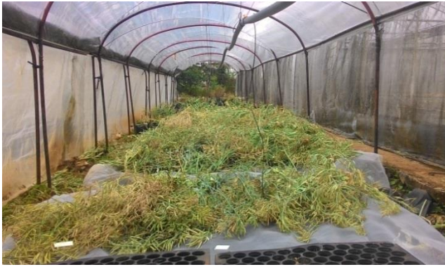
(ค) ตัดต้นผักกาดขาวปลีที่แก่แห่งตากแดดก่อนเก็บเมล็ด