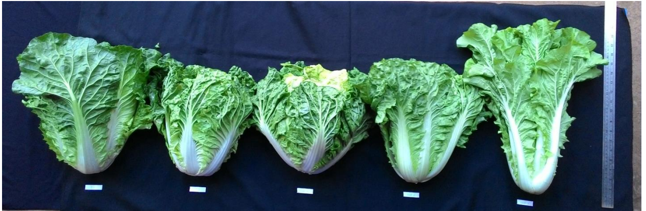
(ฉ) ลักษณะต้นผักกาดขาวปลีทั้ง 5 พันธุ์