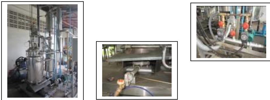
ภาพที่ 1.3-1 แสดงการปรับปรุงชุดควบคุมความร้อนและการหมุนเวียนน้ำมันทอด

ดังนั้นการพัฒนาปรับปรุงเครื่องทอดสุญญากาศต้นแบบ จึงได้ทำการปรับปรุงพัฒนาชุดควบคุมความร้อนและการหมุนเวียนน้ำมันทอด ดังแสดงในภาพที่ 1.3-1