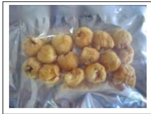
ภาพที่ 1.1-1 แสดงตัวอย่างผลิตภัณฑ์เนื้อลำไยทอดกรอบสุญญากาศ จากผลทดสอบเบื้องต้น

ตารางที่ 1.1-2 แสดงข้อมูลผลทดสอบเบื้องต้นในการทอดเนื้อลำไยด้วยเครื่องทอดสุญญากาศ ของกลุ่มวิสาหกิจชุมชนตำบลทุ่งนนทรี อ.เขาสมิง จ.ตราด