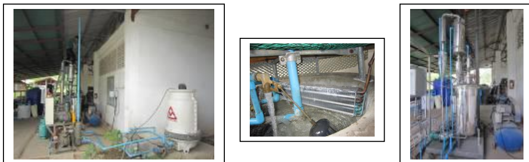
ภาพที่ 1.4-1 แสดงการปรับปรุงชุดควบแน่นไอเดือด

ดังนั้นการพัฒนาปรับปรุงเครื่องทอดสุญญากาศต้นแบบ จึงได้ทำการปรับปรุงพัฒนาชุดควบแน่นไอเดือด ดังแสดงในภาพที่ 1.4-1