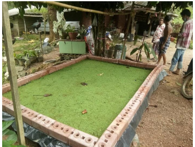
๒.นางสาวจินตนา ปานลุง ๕๓ ม.๖ ต.ลิพัง อ.ปะเหลียน จ.ตรัง