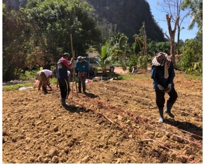
กิจกรรม: ใส่ปุ๋ยชะอม ผักเหริยงและปลูกซ่อมต้นพริกไทย