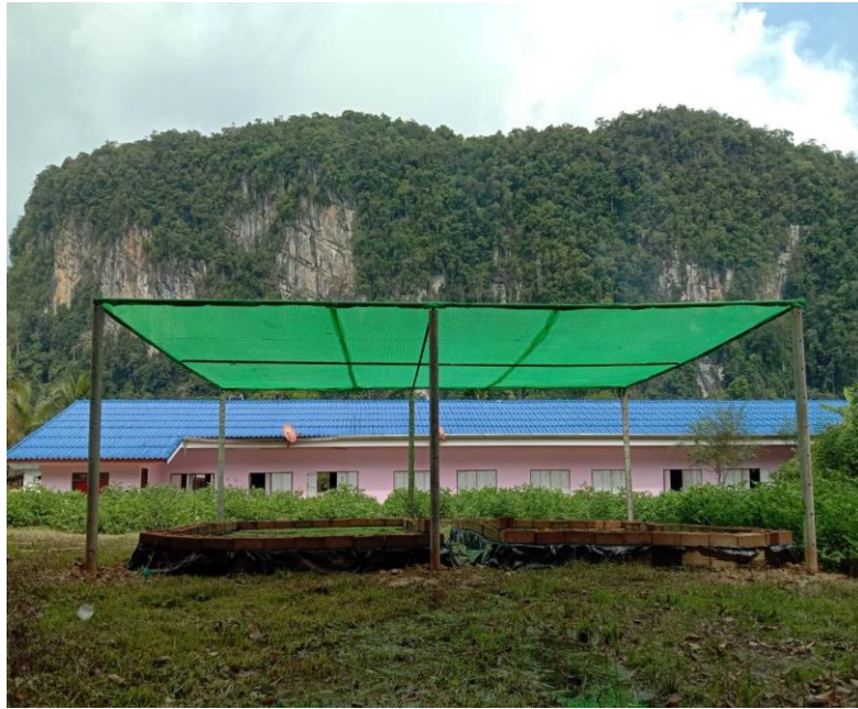
กิจกรรม : ปลูกลำไยและปรับปรุงสภาพแปลงปลูก