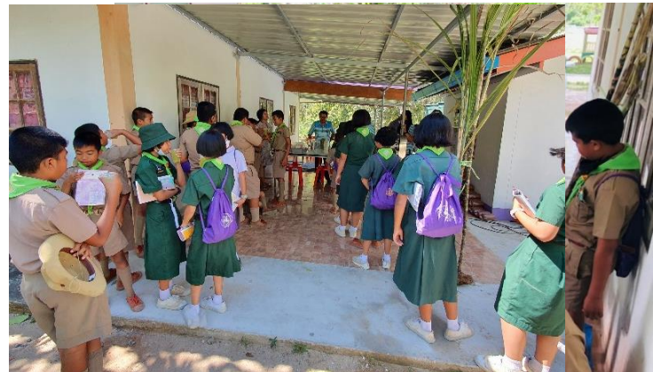
ภาพที่ ๒ จัดกิจกรรมฐานการเรียนรู้สาธิตขั้นตอนการคั้น น้ำอ้อยให้กับนักเรียนโรงเรียนตำรวจตระเวนชายแดน บ้านบาโรย ตำบลปาดังเบซาร์ อำเภอสะเดา จังหวัด สงขลา