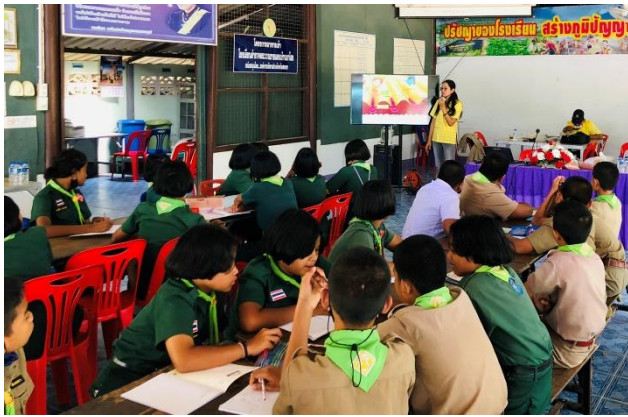
ภาพที่ ๑ บรรยายและสาธิตแปลงต้นแบบการผลิต อ้อยคั้นน้ำ ให้กับนักเรียนและผู้ปกครอง โรงเรียน ตำรวจตระเวนชายแดนบ้านบาโรย ตำบลปาดังเบ ซาร์ อำเภอสะเดา จังหวัดสงขลา