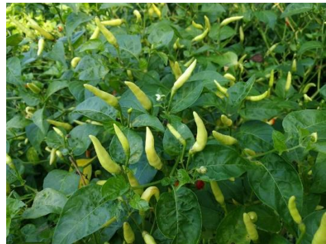
ภาพที่ ๒ เกษตรกรขยายผลรายที่ ๒ นางมะลิ นุ่นแก้ว