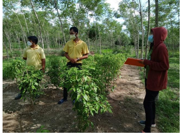
โครงการฟาร์มตัวอย่างอันเนื่องมาจากพระราชดำริฯ บ้านสะแนะ วันที่ ๒ กุมภาพันธ์ ๒๕๖๔