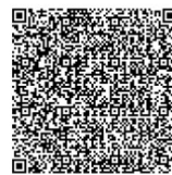
QR code แผนที่ สำนักวิจัยและพัฒนาการเกษตร เขตที่ 1