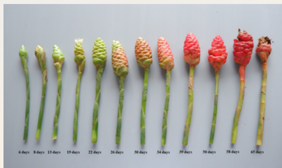
ระยะพัฒนาการของดอกกระทือ

กระทือ เริ่มให้ผลผลิตครั้งแรก ประมาณ 2 ปี หลังย้ายปลูก ซึ่งภายหลังที่มีการขุดตัว แตนหน่อ และมีการพัฒนาการด้านลำต้นอย่างเต็มที่ เริ่มแตกหน่อใหม่ช่วงเดือนเมษายน แล้วเริ่มแตกช่อดอกในช่วงปลายเดือนกรกฎาคม สามารถเก็บเกี่ยวผลผลิตได้ตั้งแต่วันที่ สิงหาคม-พฤศจิกายน ระยะดอกเหมาะสมช่อดอกที่มีดอกจริงบานหรืออายุ 20 วันหลังแทงช่อดอก