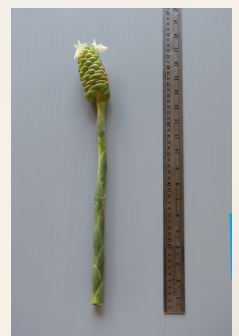
ระยะดอกที่เหมาะสม