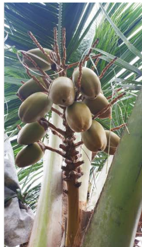
อายุ 6 เดือน