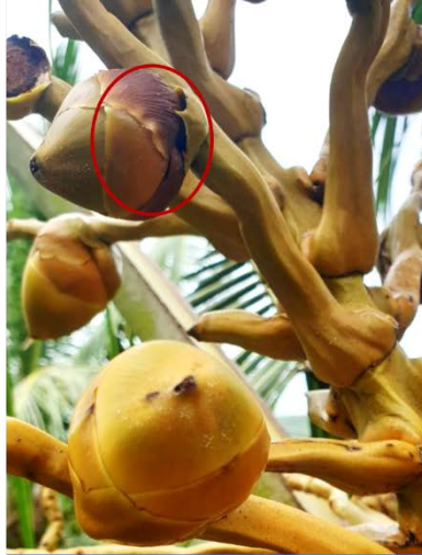
ช่อดอกเน่า