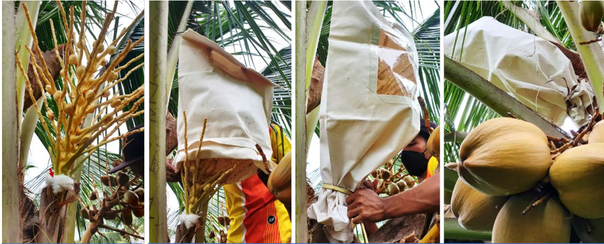
สำลีพันก้านจั่น

** กรณีแปลงแม่พันธุ์สวีลูกผสม 1 ปลูกไถล้มะพร้าวพันธุ์อื่น จึงต้องมีการ “คลุมถุง” หลังจากการทำหมัน และพันสำลีที่ใส่สารเคมีป้องกันกำจัดแมลงบริเวณก้านจั่น เพื่อป้องกันการผสมข้ามของละอองเกสรมะพร้าวพันธุ์อื่นจากตและแมลง