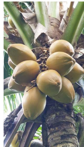
อายุ 9 เดือน