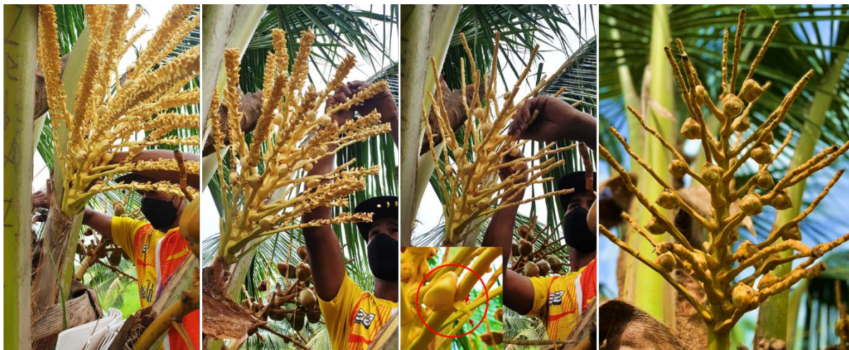
ตัดกาบจั่น

2. การทำหมัน ตัดกาบจั่นออก ตามด้วยการตัดระแง้ให้ห่างจากดอกตัวเมียประมาณ 5-10 เซนติเมตร ป้องกันไม่ให้ปลายของระแง้แห้งไปถึงดอกตัวเมีย และปลิดดอกตัวผู้ออกจากระแง้จนหมด หลังจากทำหมันแล้วประมาณ “14-18” วัน ดอกตัวเมียแรกพร้อมที่จะผสมพันธุ์