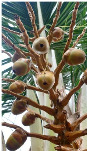
อายุ 3 เดือน

อายุมะพร้าวในแต่ละระยะ ผลมะพร้าวที่พัฒนาจนกระทั่งอายุ 3 เดือน โอกาสหลุดร่วงของผลค่อนข้างน้อย นอกจากเกิดการเข้าทำลายของโรคและแมลง และสาเหตุจากการคลุมถุงเป็นระยะเวลาสั้นหลังการทำหมัน ส่งผลกระทบต่อการหลุดร่วงของผลได้จนถึงอายุ 9 เดือน