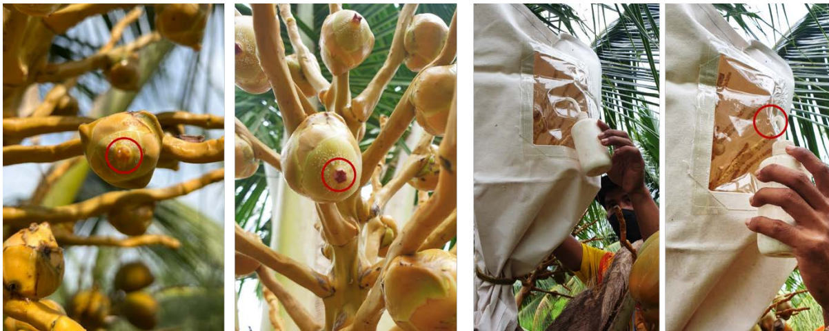
ดอกตัวเมียบาน 1 วัน

3. การผสมพันธุ์ สังเกตจากปลายยอดดอกตัวเมียที่แยกออกเป็น 3 แฉก มีน้ำหวานเยิ้ม ดอกตัวเมียบาน 1 วัน หากได้รับการผสมพันธุ์ โอกาสผสมติดค่อนข้างสูงกว่าดอกตัวเมียบาน 2-3 วัน โดยใช้อุปกรณ์ขวดฉีดน้ำกลั่น (wash bottle) บรรจุละอองเกสรผสมแป้งทาวคัม อัตรา 1:20 โดยน้ำหนัก พันที่ดอกตัวเมีย 2-3 ครั้งติดต่อกัน หรือวันเว้นวัน ขึ้นอยู่กับปริมาณ และการบานของดอกตัวเมีย ซึ่งดอกตัวเมียจะบานจากด้านล่างไปยังด้านบนของจั่น