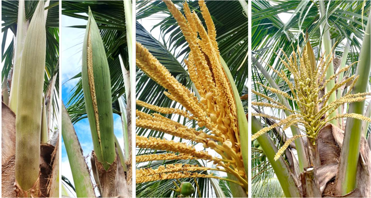
จั่นเต่ง

1. การคัดเลือก สังเกตจั่นเต่ง ลักษณะดอกตัวเมียเบ่งต้นกาบหุ้มจั่นจนกระทั่งเป็นตะปุ่มตะป่ำ และ/หรือจั่นปรี หลังจากนั้นประมาณ 3-5 วัน “จั่นแตก” ให้เลือกจั่นแตกสำหรับการทำหมัน