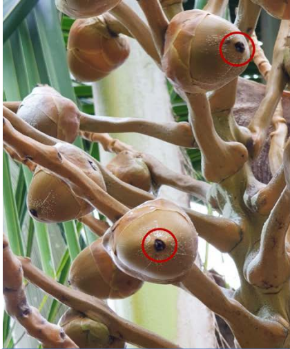
ดอกตัวเมียผสมติด

หลังจากผสมพันธุ์ประมาณ 5-7 วัน ตรงปลายยอดดอกเกสรตัวเมียจะเปลี่ยนเป็นสีน้ำตาลหรือสีดำ ** กรณีมีการคลุมถุงดอกตัวเมียที่ได้รับการผสมพันธุ์จะหลุดร่วงก่อนการเก็บเกี่ยว เพราะอุณหภูมิภายในถุงคลุมค่อนข้างสูง ส่งผลให้ดอกตัวเมียดำเน่า และเกิดอาการเน่าบริเวณช่อดอก หรือปลายดอกตัวเมียแห้งเกิดจากเชื้อราเข้าทำลาย