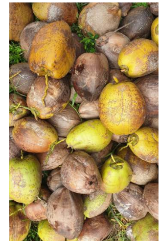
อายุ 10-12 เดือน