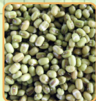
นำเมล็ดเช่น้ำธรรมดาหรือน้ำอุ่น 6 ชม.