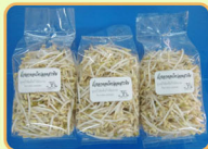
นำถั่วงอกที่ได้มาตัดรากและล้างเปลือกออกจะได้ถั่วงอกปลอดสารพิษพร้อมบริโภคหรือจำหน่าย