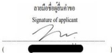
ภาพลายเซ็นจากแอปพลิเคชัน Notepad+