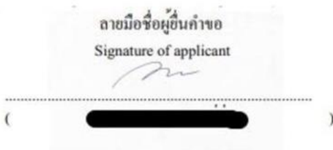
ภาพลายเซ็นจากการสแกน