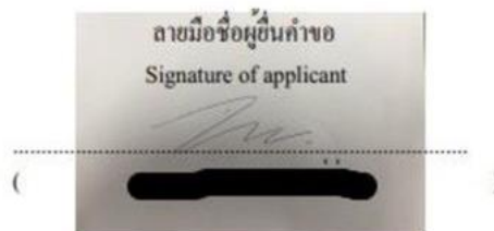
ภาพลายเซ็นจากการถ่ายภาพ