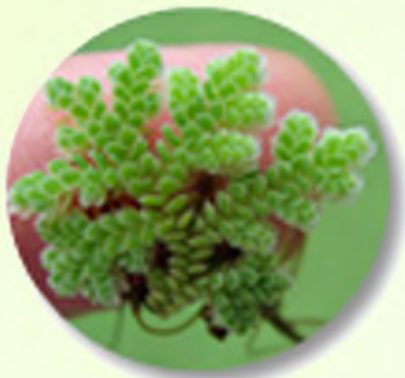
ສາຍພັນຮູ້ທີ່ ກຸ່ມວິທະຍາສາດ ຕັດເລືອກແລະປັບປຸງພັນຮູ້ A. microphylla