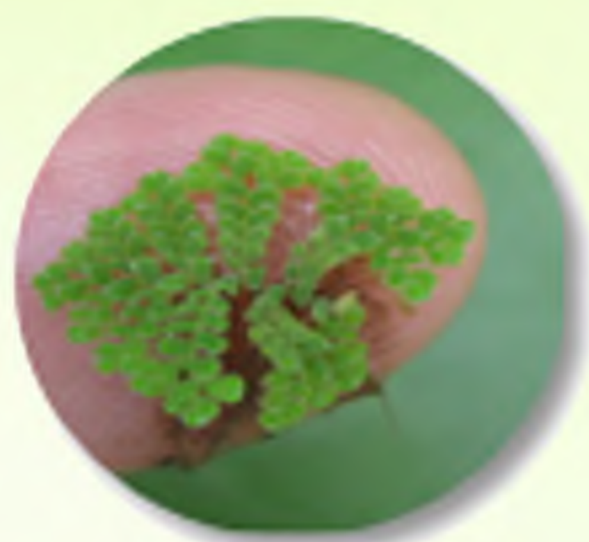
ພັນຮູ້ພື້ນເມືອງ A. pinnata

ແລະປັບປຸງພັນຮູ້ ລັກຮອຍເດັ່ນ ຄື ມີບໍ່ເນື້ອນ ບາຍພັນຮູ້ໄດ້ຮວດຣຽວ ໃຫ້ຜົນຜົນຫຼາກກວ່າພັນຮູ້ ພື້ນເມືອງຄື 10 ເທົ່າ