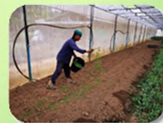
ການນຳແຂນແດງໄປໃຊ້ໃນການປຸກຜັກອິນທຣີຍ໌