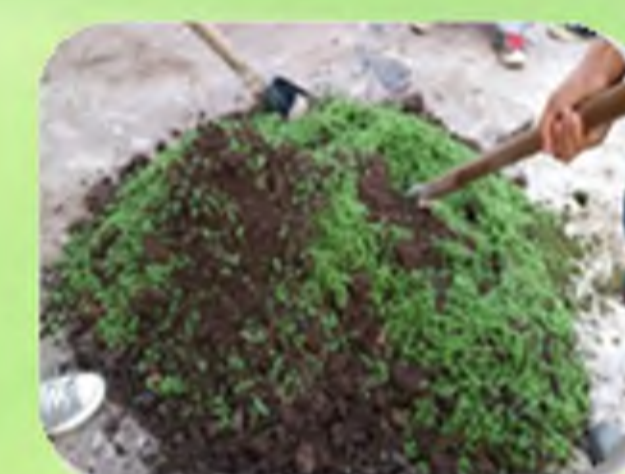
ແຂນແດງສຸດສມວັຊປຸກ