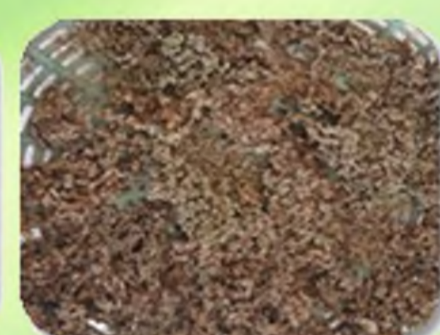
ແຂນແດງແກ້ງ