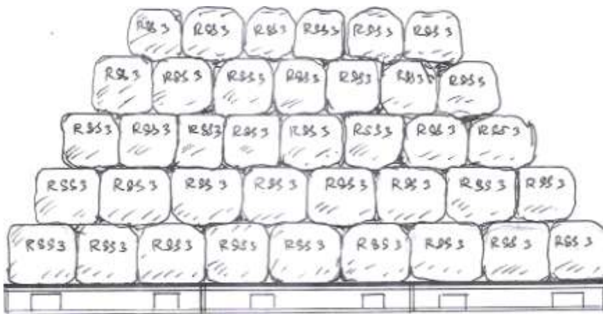
ภาพที่ ฉ.1 ตัวอย่างการวางซ้อนยาง 5 ชั้น แบบสับหว่าง

ฉ.1.4.1 กรณีเก็บยางในโกดังไม่เกิน 3 เดือน สามารถซ้อนยางได้ 5 ชั้น แบบสับหว่าง โดยแต่ละชั้นอาจไม่ต้องใช้วัสดุรอง แต่ต้องวางก้อนยางในรูปทรงพีระมิด เพื่อป้องกันก้อนยางล้ม