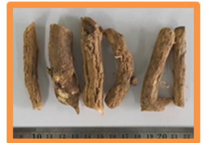
รากระย้อม

เจริญเติบโตได้ดีในดินร่วนซุยและผสมกับอินทรีย์วัตถุ ต้องการความชุ่มชื้นของดิน มีเขตการกระจายพันธุ์กว้าง พบได้ตั้งแต่ศรีลังกา อินเดีย เนปาล ภูฏาน ภูมิภาคอินโดจีน พม่า จีน และมาเลเซีย ส่วนในประเทศไทยพบได้ทั่วทุกภาค โดยมักขึ้นตามที่โล่งในป่าเบญจพรรณ ป่าเต็งรัง ป่าดิบชื้น และป่าดิบแล้ง