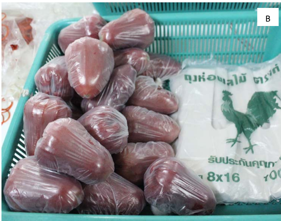
Figure 2. Experiment 2: Rose apples were tightly wrapped individually by different plastic bags before exposing to gravid females for oviposition. A. Polyester spunbond bag (12.5 x 16.5 inches); B. White plastic bag (8 x 16 inches)