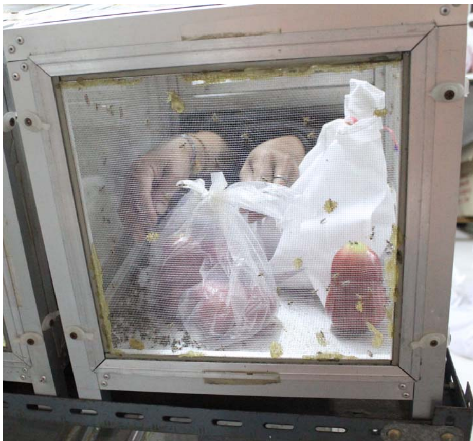
Figure 3. Tested fruits were exposed to gravid females for oviposition for 24 hours in infestation cages