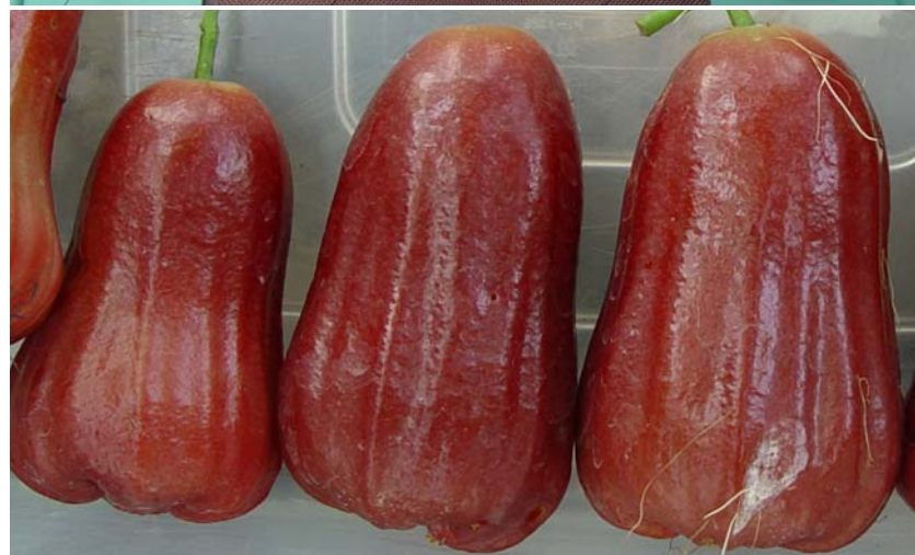
Figure 4. Rose apple fruit development from 7 days to 42 days