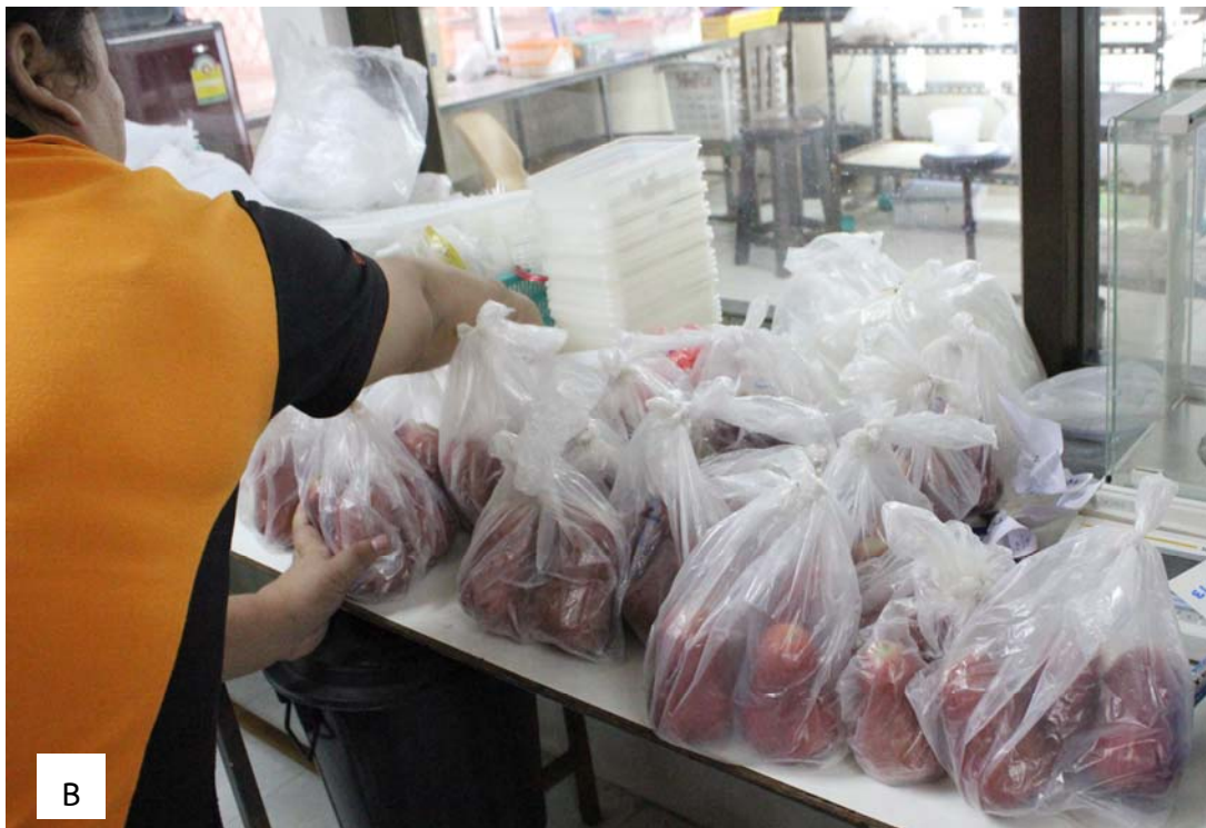
Figure 1. Experiment 1: 3 rose apples were held in a bag before exposing to gravid females for oviposition. A. Polyester spunbond bag (12.5 x 16.5 inches); B. White plastic bag (8 x 16 inches)