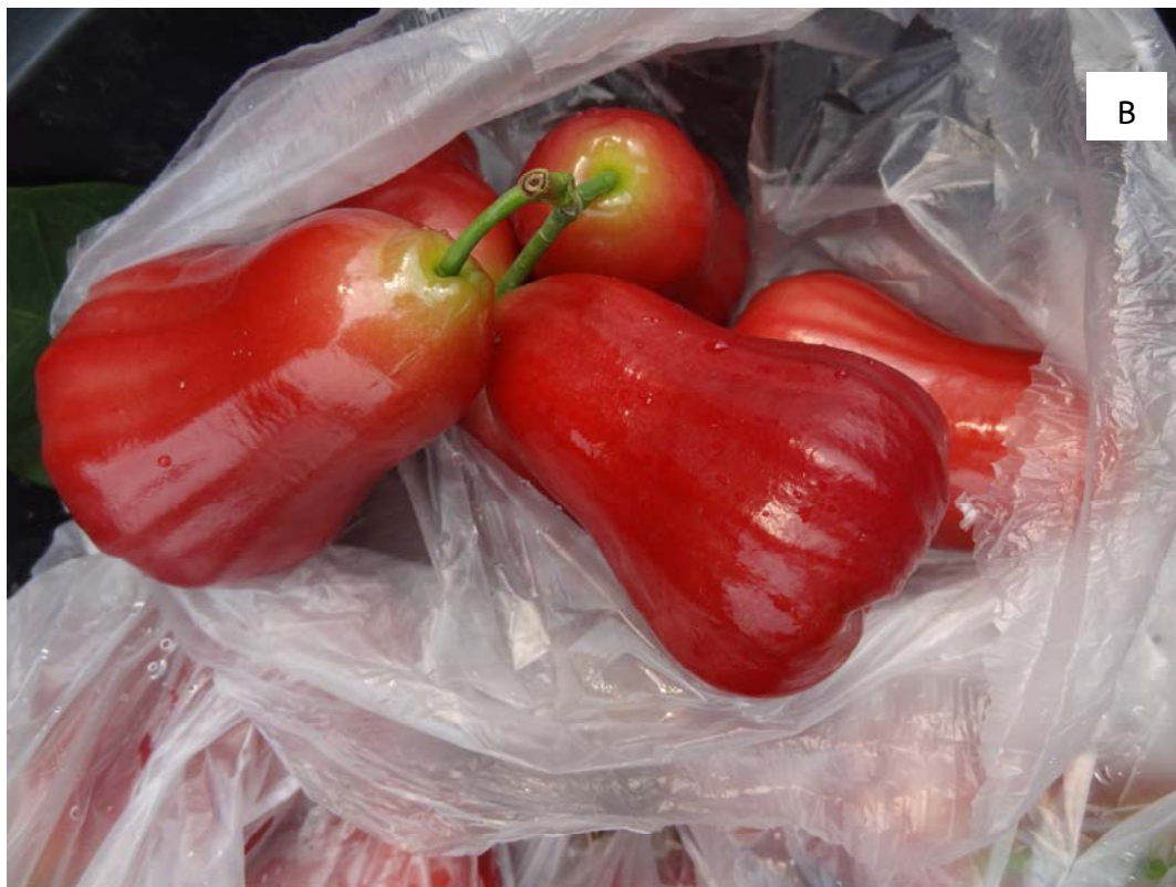
Figure 7. Quality of rose apples in different bags.

A. Polyester spunbond bag; B. White plastic bag.