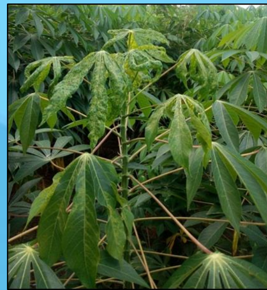
ใบด่างเหลืองชัดเจนที่ส่วนยอด แต่ใบล่างยังปกติ เนื่องจากได้รับการถ่ายทอดโรคจากแมลงหิวขาอายุสุบที่มีเชื้อไวรัส จึงแสดงอาการรุนแรงจากส่วนยอดลงมาสู่ใบล่างของต้น