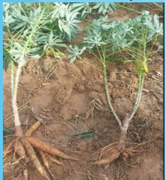
หัวมันสำปะหลังจากต้นปกติเปรียบเทียบกับต้นที่เป็นโรค