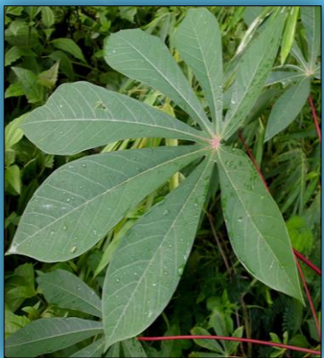
ใบมันสำปะหลังปกติ

หมั่นเดินตรวจแปลงตั้งแต่เริ่มปลูกทุกๆ 2 สัปดาห์ หากพบอาการต้องสงสัยเช่น ใบหงิก ใบด่าง ให้แจ้งเจ้าหน้าที่กรมวิชาการเกษตร หรือกรมส่งเสริมการเกษตรในพื้นที่ มาวินิจฉัยโรค เจ้าหน้าที่จะชุดถอนทำลายต้นต้องสงสัยออกจากแปลง นำไปฝังกลบ พ่นต้นที่เหลือในแปลงและแปลงข้างเคียงด้วยสารฆ่าแมลงเพื่อทำลายแมลงหิวขาอายุสุบ ติดตามโรคในแปลงอย่างต่อเนื่องทุก 2 สัปดาห์