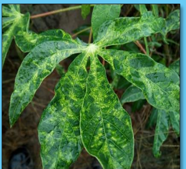
อาการต่างเขียวขีดสลับเขียวเข้ม