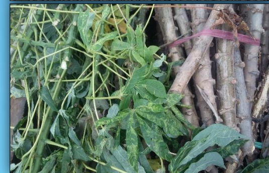
อาการใบด่างบนท่อนพันธุ์มันสำปะหลังในกัมพูชาที่มาจากเวียดนาม

เฝ้าระวังและป้องกันท่อนพันธุ์ติดโรคใบด่างมันสำปะหลัง