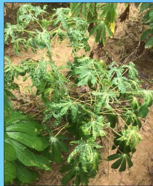
ใบด่างเหลืองทั้งใบยอดและใบล่างเนื่องจากใช้ท่อนพันธุ์ที่เป็นโรคมานปลูก