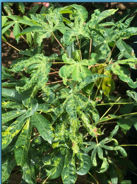
ใบย่อยบิดเบี้ยวหงิกงอ โค้งเสียรูปทรง

ใบอ่อนและใบที่เจริญใหม่มีขนาดเล็กลง ยอดหงิก ต้นแคระแกร็น