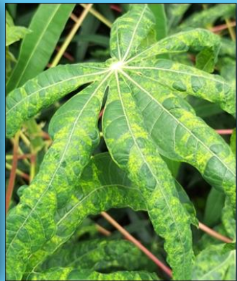
อาการต่างเหลือง