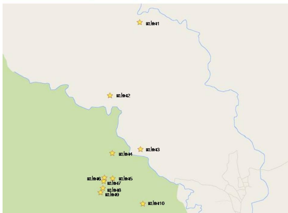
ภาพที่ 2 แผนที่แสดงพื้นที่เข้าร่วมโครงการทดสอบระบบการผลิตข้าว-ถั่วลိสง ต.วังเงิน อ.แม่ทะ จ.ลำปาง จำนวน 10 แปลง