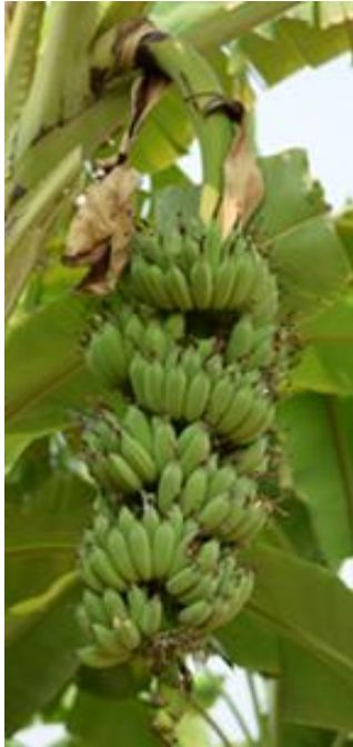
ลักษณะ และขนาดเครือกล้วยน้ำว้า สายต้น สท. 55-4