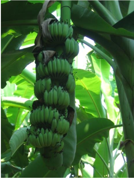
กล้วยน้ำว้าสท. 55-4