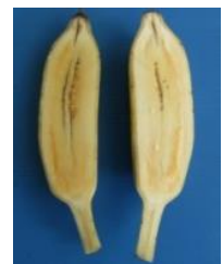
รูปร่างผล : ตรง