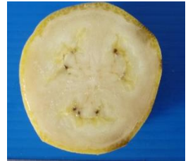
กล้วยน้ำว้าสายต้นสท. 55-50