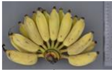
ลักษณะหวีสุกกล้วยน้ำว้า สายต้น สท. 55-4