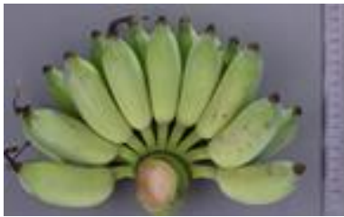
ลักษณะหวีดิบกล้วยน้ำว้า สายต้น สท. 55-4