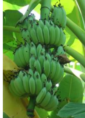
ลักษณะ และขนาดเครือกล้วยน้ำว้ามะลิอ่อน