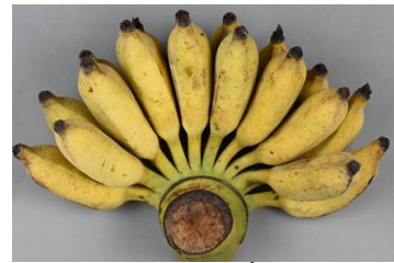
ลักษณะหวีสุกกล้วยน้ำว้ามะลิอ่อน