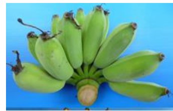
ลักษณะหวีดิบกล้วยน้ำว้ามะลิอ่อน