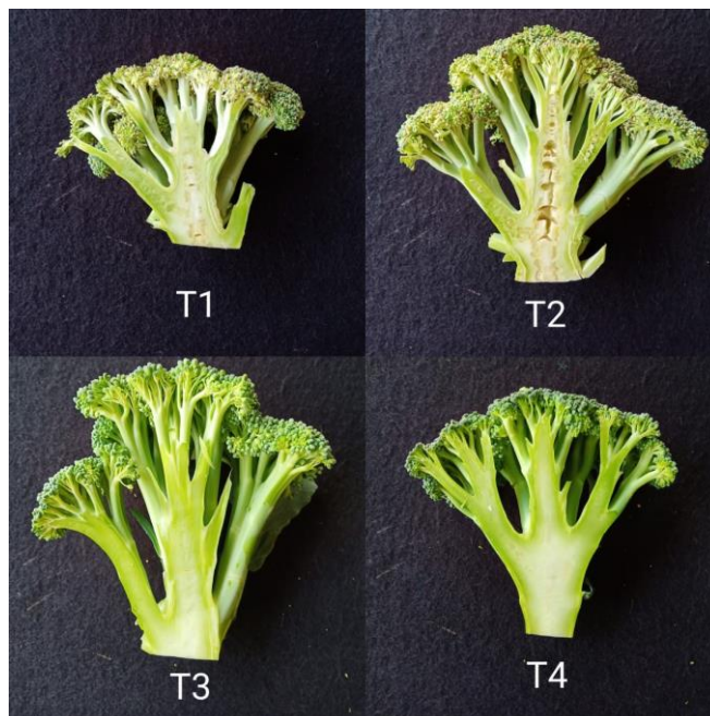
ภาพที่ 2 อาการไส้กลางในบร็อกโคลี่ที่ได้รับปุ๋ยในอัตราต่างๆ ตามกรรมวิธีที่กำหนดไว้