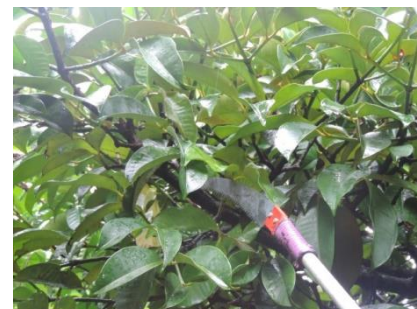
ภาพที่ 1.2-1 ต้นมังคุดก่อนตัดแต่งทรงพุ่ม (ซ้าย) และขณะตัดแต่งกิ่ง (กลางและขวา) ปี 2559