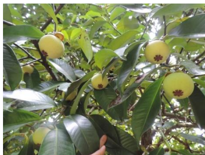
ภาพที่ 1.2-3 การให้ผลผลิตของต้นมังคุดหลังตัดแต่งทรงพุ่มปี 2559