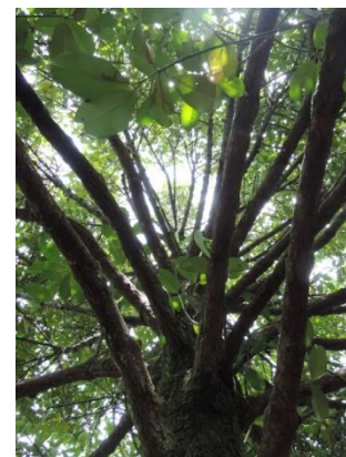
ภาพที่ 1.2-2 ต้นมังคุดหลังตัดแต่งภายนอกทรงพุ่ม (ซ้าย) ภายในทรงพุ่มกรรมวิธีที่ 2 (กลาง) และกรรมวิธีที่ 3 (ขวา) ปี 2559