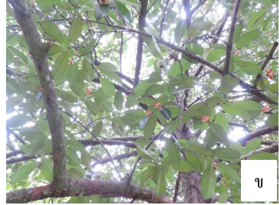
ภาพที่ 1.2-3 การออกดอกบริเวณนอกทรงพุ่มของมังคุด (ก) และการออกดอกที่กิ่งแขนง ภายในทรงพุ่มที่เลี้ยงไว้สำหรับให้ผลผลิต (ข) (ปี 2560)