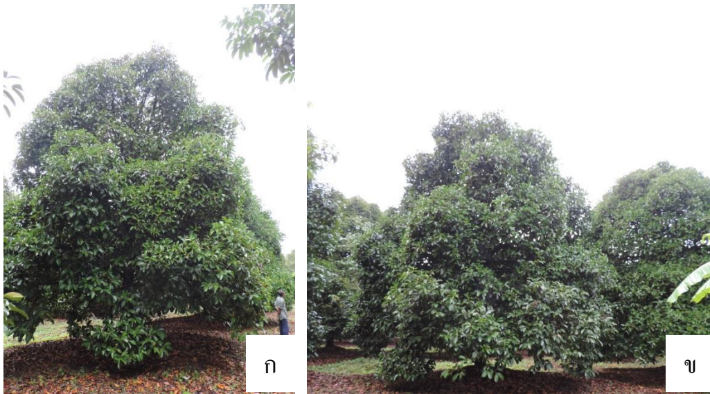
ภาพที่ 1.2-1 ต้นมังคุดหลังตัดแต่งทรงพุ่ม 1 ปี (ก-ข) (ปี 2560)