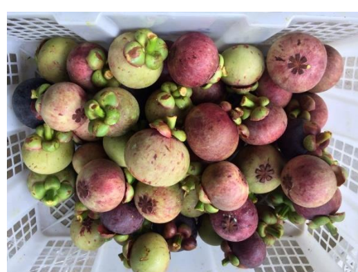
ภาพที่ 1.2-1 สภาพแปลงทดลอง การออกดอก และติดผลของมังคุดในแปลงทดลอง ปี 2562