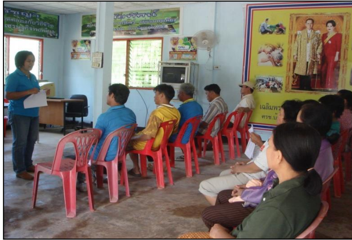
คณะผู้วิจัยประชุมชี้แจงผลการดำเนินการปี ๒๕๕๔ เกษตรกรร่วมกันวางแผนการจัดการศัตรูกะหล่ำปลีและคัดเลือกเกษตรกรร่วมดำเนินการทดลองในปี ๒๕๕๕