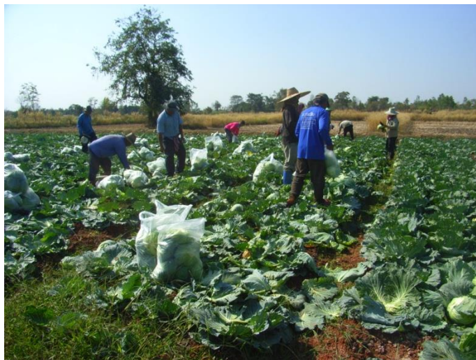
การเก็บข้อมูลผลผลิตกะหล่ำปลีในวันเก็บเกี่ยวของเกษตรกร