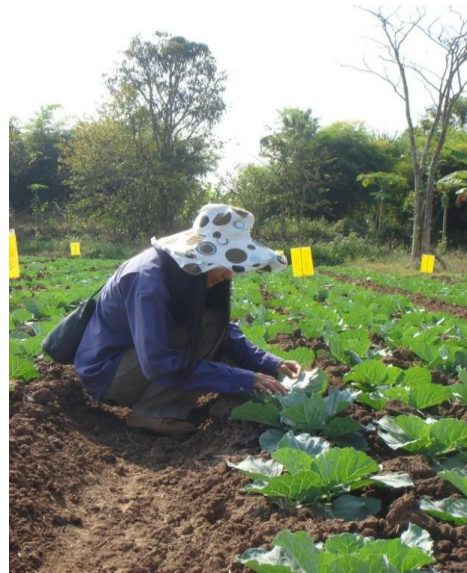
การสำรวจศัตรูกะหล่ำปลีในแปลง