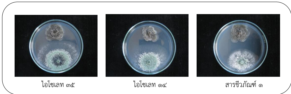
ภาพที่ ๓ เปรียบเทียบประสิทธิภาพของราไตรโคเดอร์มา ในการยับยั้งการเจริญของเส้นใยเชื้อรา P. citricarpa โดยวิธี Dual Culture test หลังจากบ่มเชื้อไว้ ๓ วัน ที่อุณหภูมิห้อง