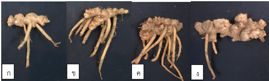
ภาพที่ ๒ ลักษณะหัวพันธุ์ชิงพลอดโรค (Go) ที่ได้จากการใช้หัวพันธุ์ (minirhizome) มาปลูกในโรงเรือน ด้วยระยะปลูก ๑๕x๑๕ ซม. (ก) , ๑๕x๒๐ ซม.(ข) , ๒๐x๒๐ ซม. (ค) และ ๒๐x๒๕ ซม. (ง)

ตัวเลขที่ตามหลังด้วยอักษรที่เหมือนกันแต่ละกรรมวิธีไม่แตกต่างกันทางสถิติโดยวิธี LSD ที่ระดับความเชื่อมั่น ๙๕%