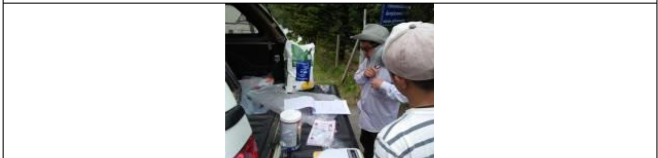
ภาพที่ 5 เตรียมสารเคมี ตามกรรมวิธี