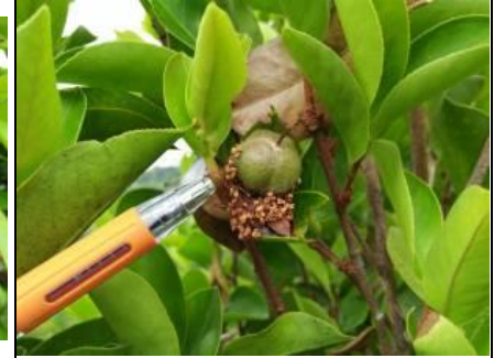
ภาพที่ 7 ผลของต้นขนาน้ำมันพันธุ์ C. gaucowensis ที่ติดผล