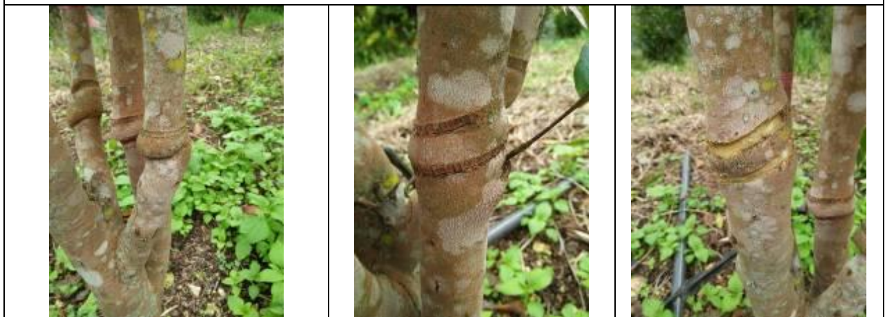
ภาพที่ 2 รอยแผลจากการควั่นครึ่งก่อนหน้า