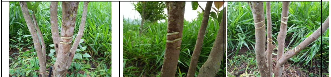
ภาพที่ 4 รูปแบบการคว้งกิ่งของต้นชาน้ำมันพันธุ์ C. gawcowensis