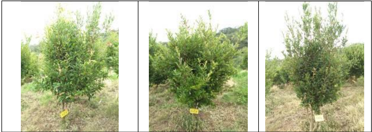
ภาพที่ 1 คัดเลือกต้นที่มีลักษณะ ขนาดที่ใกล้เคียงกันมากที่สุด