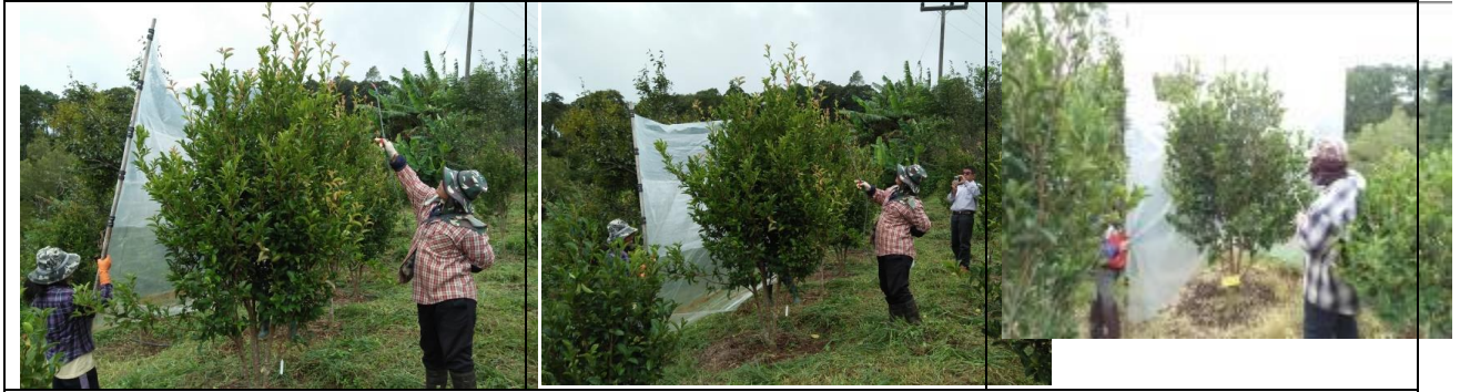
ภาพที่ 6 พันธ์สารเคมีในเดือนสิงหาคม 2561