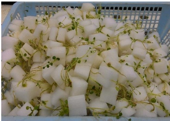
(ค) ลักษณะต้นมันฝรั่งที่ปลูกในระบบไฮโดรโปนิก