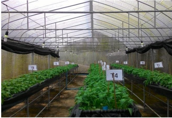
(ค) ต้นมันฝรั่งอายุ 35 วัน