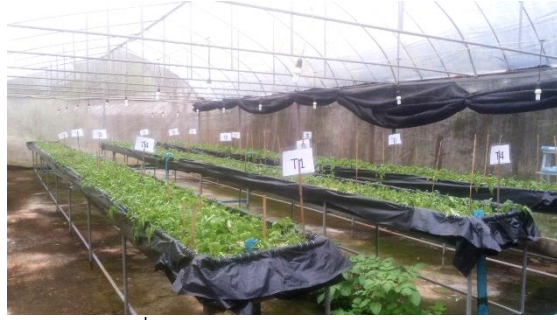
(ข) ต้นมันฝรั่งหลังการตัดยอด