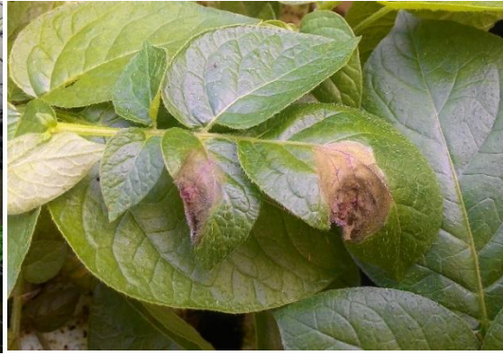
(ง) โรคใบไหม้เข้าทำลาย 50 วันหลังปลูก

ภาพที่ 2 การพ่นฮอร์โมน BAP และการเกิดโรคใบไหม้ ที่ ศกส.ชม. (ขุนวาง) ปี 2561 (ก-ง)