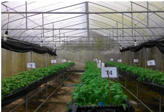
(ค) ต้นมันฝรั่งอายุ 35 วัน