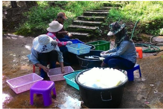
(ข) นำต้นมันฝรั่งออกจากขวดเพาะเลี้ยงเนื้อเยื่อ