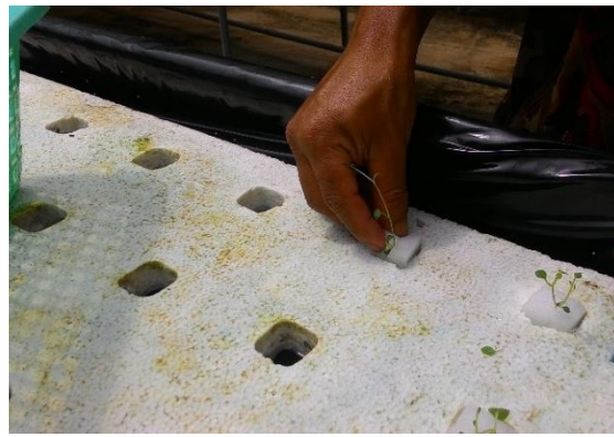
(ง) ปลูกต้นอ่อนมันฝรั่งในระบบไฮโดรโปนิก

ภาพที่ 1 การปลูก และดูแลรักษา ที่ ศกส.ชม. (ขุนวาง) ปี 2561 (ก-ง)