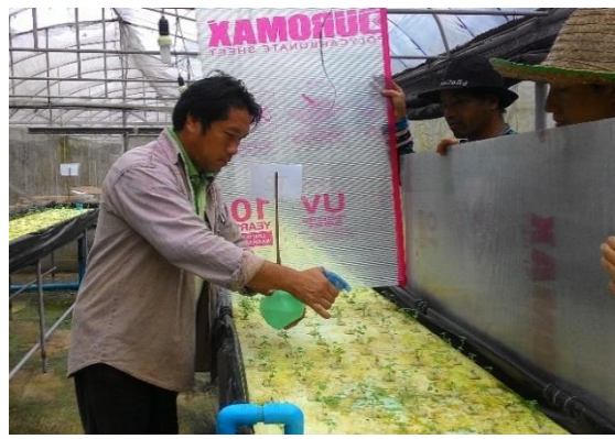
(ข) พ่นฮอร์โมน BAP หลังย้ายปลูก 2 สัปดาห์