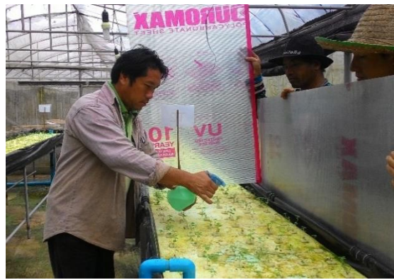
(ข) ฟันฮอร์โมน BAP หลังย้ายปลูก 2 สัปดาห์