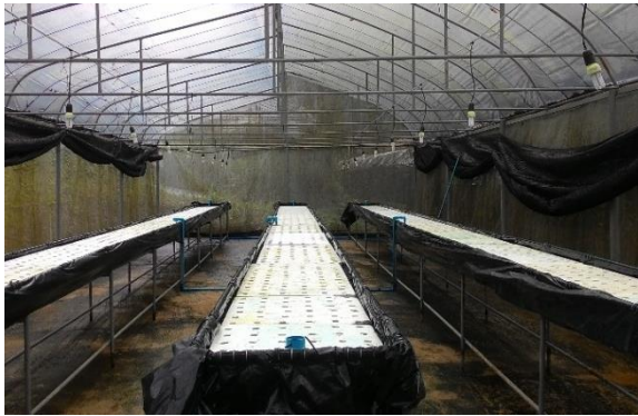
(ก) เตรียมโรงเรือนสำหรับปลูกต้นอ่อนมันฝรั่ง