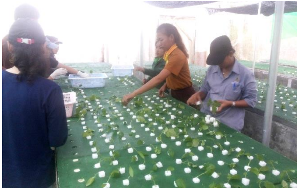
(ค) นำยอดปักชำลงในระบบแอโรโพนิค