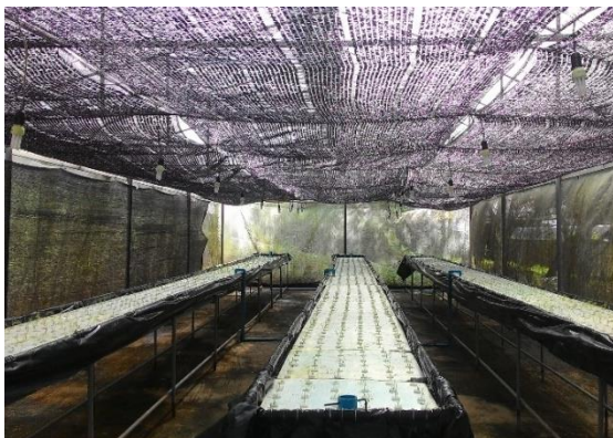
(ก) โรงเรือนไฮโดรโปนิก

ภาพที่ 1 การปลูก และดูแลรักษา ที่ ศกส.ชม. (ขุนวาง) ปี 2561 (ก-ง)