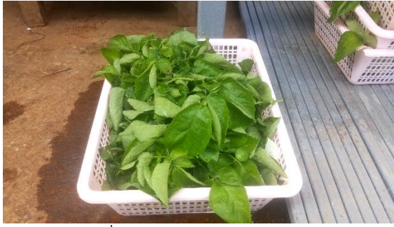
(ก) ยอดมันฝรั่ง