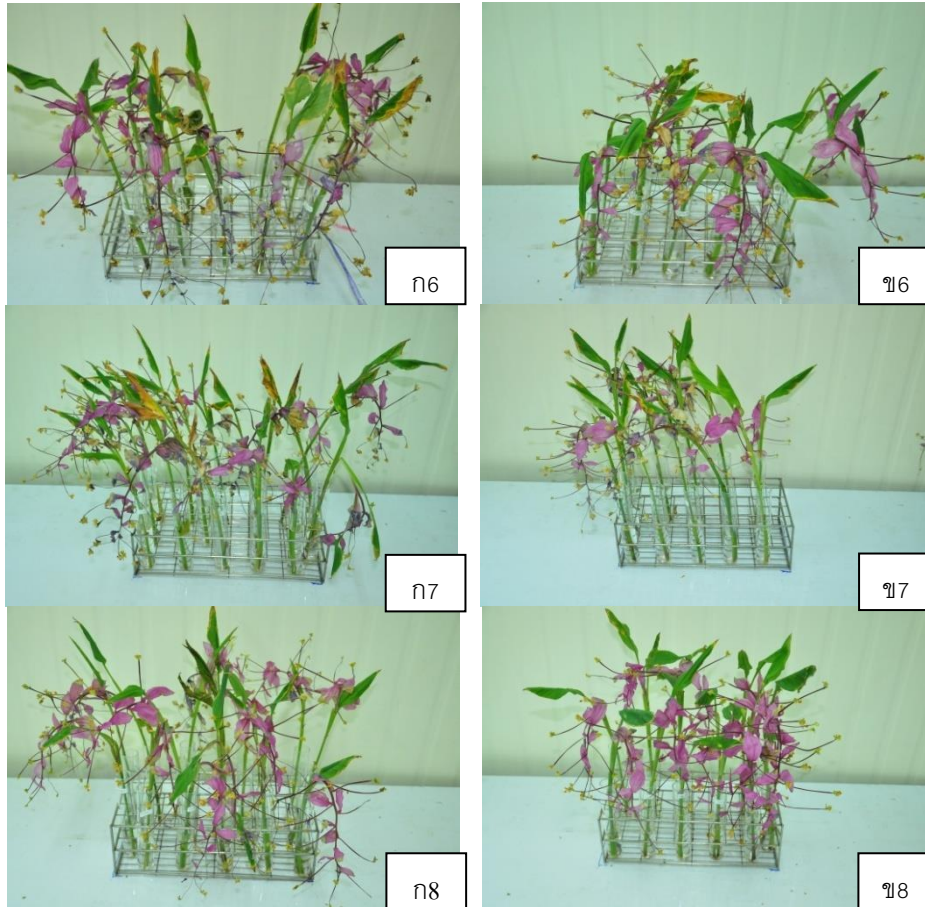
ภาพที่ ๘ ลักษณะของช่อดอกหงส์เหินหลังปักแจกัน ๘ วัน ช่อดอกที่ไม่ได้แช่น้ำ (ก) ช่อดอกที่แช่น้ำนาน ๑ ชั่วโมงก่อนขนส่ง (ข) กรรมวิธีควบคุม(๑) สารการค้ำ A (๒) คลอโรกซ์ (๓) สารละลายกรดซิตริก (๔) ฟันอะมิโนแอซิด (๕) ฟัน MgSO_4 (๖) ฟันไคโตซาน (๗) และฟัน BA (๘)