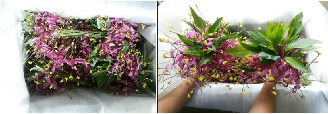
ภาพที่ ๒ การบรรจุหงส์เหินลงกล่อง (ก) ลักษณะของใบและช่อดอกหงส์เหินที่ไม่ได้แช่น้ำ (ซ้าย) และแช่น้ำนาน