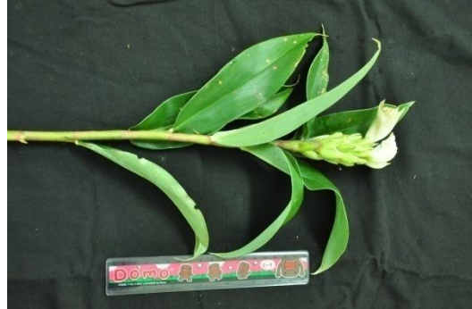
ภาพที่ ๑ การบรรจุลงกล่อง (ซ้าย) ลักษณะของใบและช่อดอกเอื้องหมายนาพันธุ์พื้นเมืองศรีสะเกษ (ขวา)