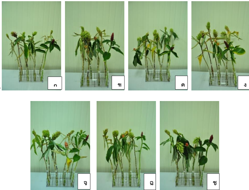
ภาพที่ ๔ ลักษณะของช่อดอกเอื้องหมายนาหลังปักแจกัน ๗ วัน กรรมวิธีควบคุม(ก) สารการค้า A (ข) คลอโรกซ์ (ค) สารละลายกรดซิทริก (ง) พ่น MgSO_4 (จ) พ่นโคโตซาน (ฉ) และพ่น BA (ช)

ค่าเฉลี่ยที่ตามด้วยตัวอักษรไม่เหมือนกันในแนวตั้ง แตกต่างอย่างมีนัยสำคัญทางสถิติที่ระดับความเชื่อเชื่อมั่น ๙๕%