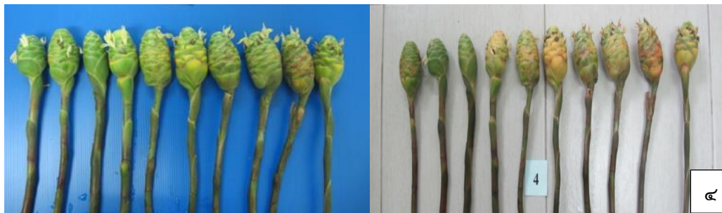
ภาพที่ ๖ คุณภาพดอกกระเทียมปักแจกัน ๗ วันในกรรมวิธีต่างๆ ๑.น้ำเปล่า (เปรียบเทียบ) ๒. ฟัน BA ๑๐๐ ppm ปักแจกันด้วยน้ำเปล่า ๓. ฟันโคโตซาน ๑มล./ล ปักแจกันด้วยน้ำเปล่า ๔. พัลซิ่งด้วย Floralife ๑ เม็ด/ ๒ ลิตร ๔ชม. (สาร:pulsingการค้า) ปักแจกันด้วยน้ำเปล่า