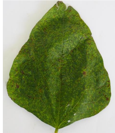
แปลงที่ 3 แปลงปลูกถั่วเขียว นายจำลอง เพชรรัตน์ ม.2 ต.ลำพยนต์ อ.ตากฟ้า จ.นครสวรรค์