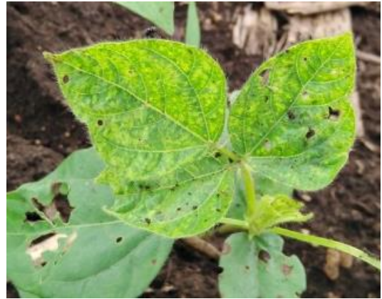
แปลงที่ 2 แปลงปลูกถั่วเขียว นางบุญรอด พันหลง ม.4 ต.ลำพยนต์ อ.ตากฟ้า จ.นครสวรรค์